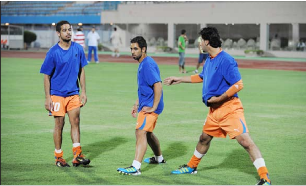
كاظمة يسعى لبدء قوية هذا الموسم