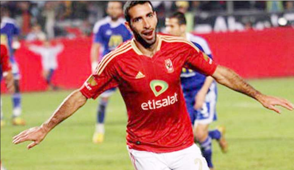
محمد أبوتريكة يخضع لفترة علاج

وكان محمد بركات قد حضر إلى ملعب مختار للتشجيع صباح السبت للمشاركة في مفاجأة سارة لزملائه بالأهلي وطلب المشاركة في التقييمة الجماعية وهو الأمر الذي وافق عليه محمد يوسف.