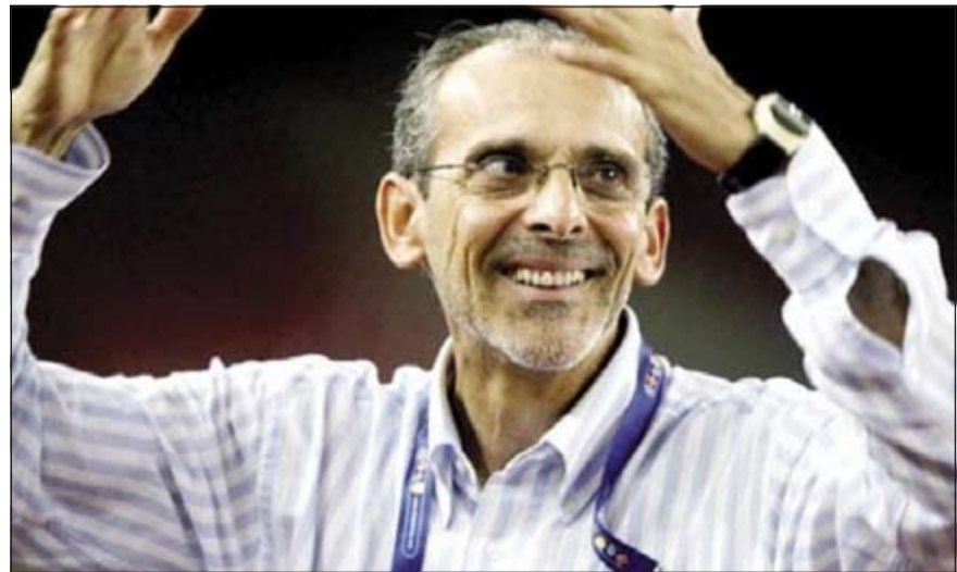
مدرب الأزرق البرتغالي جورفان فييرا يعود قبل كأس السوبر

إلى عدد من الإداريين ولاعبين خصوصاً من إدارته وعلاقته في القادسية بسبب علاقته الوطيدة بهم خلال فترة توليه تدريب الأصفر في فترة سابقة.