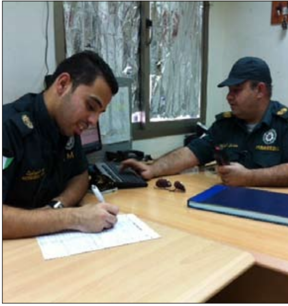
تسجيل وإعداد إحصائية بالبلاغات