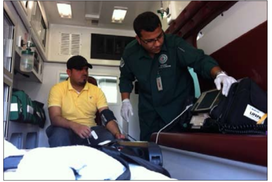
«الأنباء» تعيش جو المسعفين في سيارة الإسعاف

«الأنباء» جالت على عدد من مراكز الإسعاف لتشارك «الجنود المجهولين» مشاكلهم وهمومهم