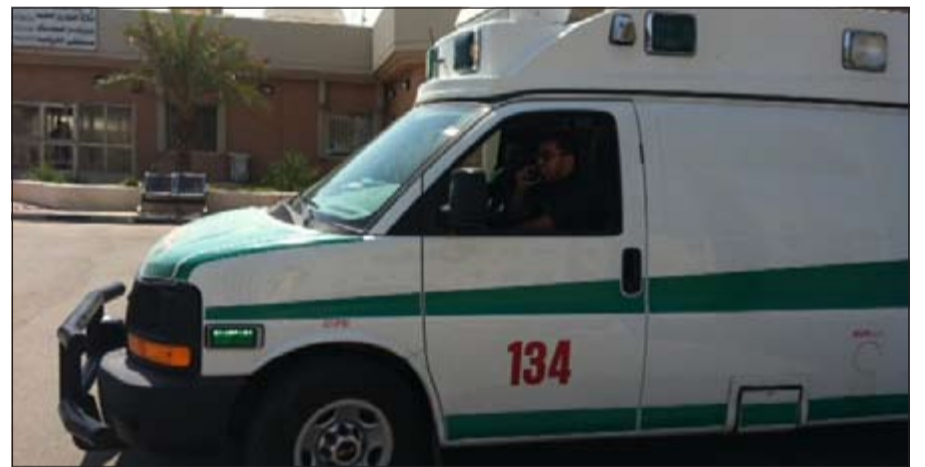
إحدى سيارات الإسعاف تتنقل لتلقي نداء الواجب