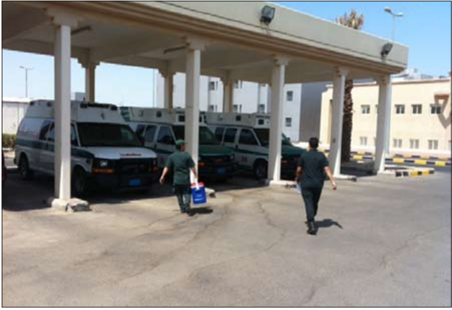
الاستعداد للخروج إلى أحد المواقع لتلبية البلاغ عن وجود مريض يحتاج سيارة إسعاف