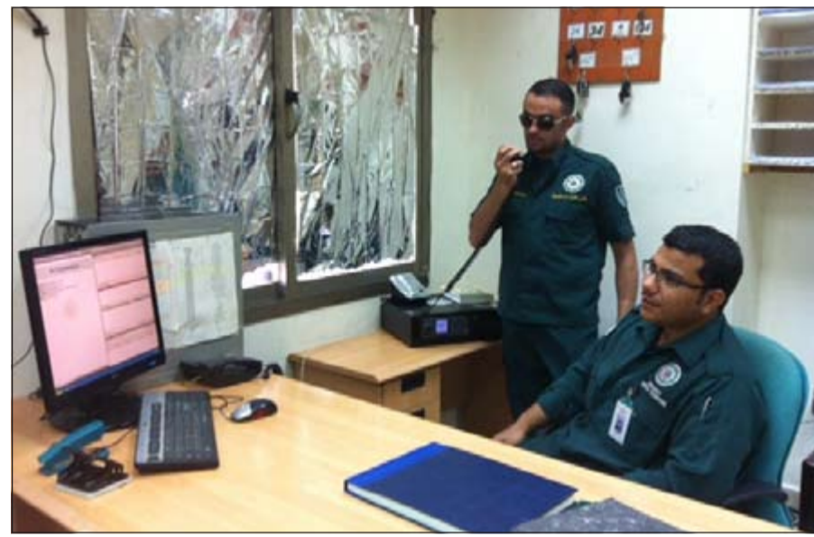
فنيو الطوارئ الطبية يتلقون البلاغات ويستعدون لإرسال سيارة إسعاف لأحد المواقع

البدلات الخاصة بالعدوى والخطر، وتصنيف المهنة واعتبارها من المهن الشاقة لضمان تمسك العاملين فيها بها، وعدم هجرتهم إلى جهات أخرى بنفس المهنة، للحصول على امتيازات أكثر، علماً أن فنيي الطوارئ الطبية يعملون في جميع الأوقات سواء في الصيف أو الشتاء أو المطر أو الغبار وغيرها، ويتعرضون لعدة مخاطر، خاصة في عمليات نقل المرضى المصابين بأمراض معدية فمن الممكن أن ينتقل إليهم هذا المرض، ولهذا فهم يستحقون الالتفات إليهم.