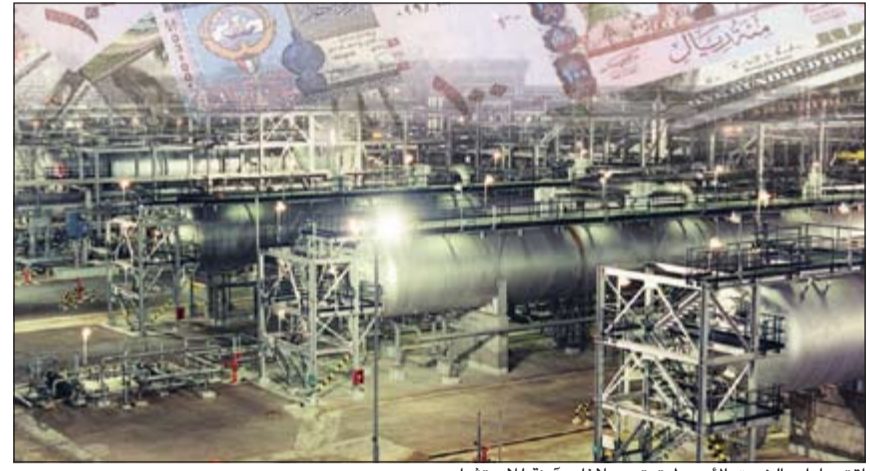
اقتصادات الشرق الأوسط تعتبر ملاذات آمنة للاستثمار

لندن (رويترز): يتجه المستثمرون العالميون إلى الشراء في الشركات ذات الإدارة الرشيدة بأسواق الأسهم في الشرق الأوسط وحتى في بعض أسواق شمال أفريقيا نظراً لثباتها إلى ما هو أبعد من المشاكل في منطقة قبض مضاجعها تغيير النظام في مصر وأزمة أمنية في اليمن وحرب أهلية في سورية. ومنطقة الشرق الأوسط وشمال أفريقيا عالم استثماري متنوع السمات يضم مستوردين ومصدرين للطاقة واقتصادات تحقق فوائض وأخرى تسجل عجزاً لكن مع تجارة واستثمار عابرين للحدود وحزم معونات.