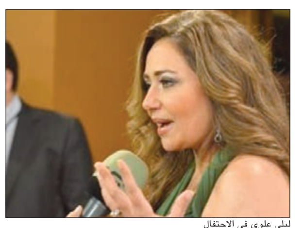
ليلى علوي في الاحتفال

بعد حصول مسلسل «فرح ليلي» على المرتبة الأولى في استفتاء الفضائية المصرية، فيما اعتبر المسلسل الأكثر تسويقاً، حسب الإحصائية التي أشارت إليها إحدى الصحف اليومية. وبعد انتهاء حفلة السمر، قام المخرج خالد الحجر بتصوير مشاهد الحفلة التي ضمت جميع أبطال العمل، وقدمت خلالها المطربة التونسية غالية بن علي أغنية.