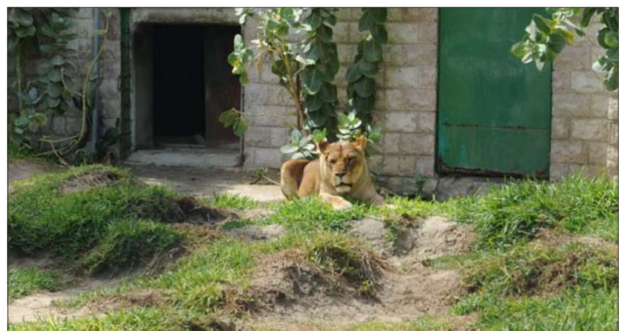
البؤة تخلد للراحة بعيدا عن متابعيها

بعد شهر رمضان المبارك، وتمضية لياليه في الصلاة والقيام والتبذل والدعاء، جاء الفضل من الله عز وجل بعيد فطر جميل يتجهج فيه المسلمون ويفرحون بعباءة الله لهم وكرمهم، فهاهي وجوههم قد نورت بثقافات الشهر الفضيل فرأوا في أيام العيد يجتمعون ليصلوا أرحامهم، ويقوموا بزيارة الأماكن المحببة إلى قلوبهم.