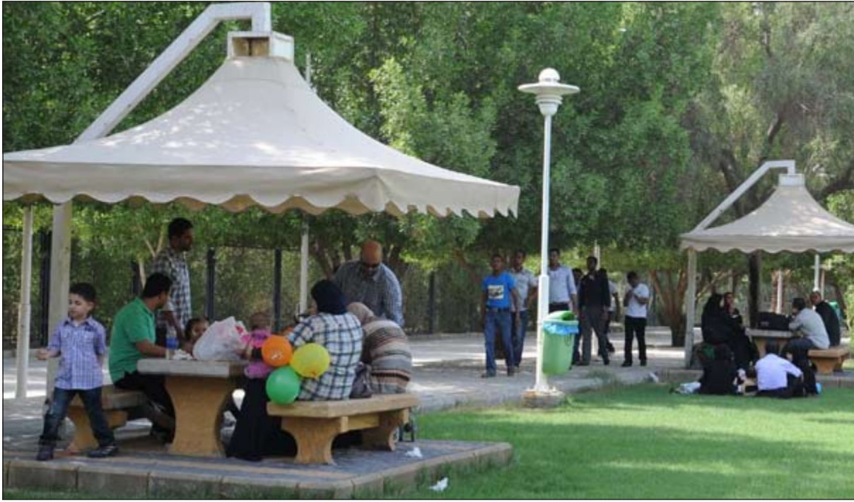
المساحات الخضراء في حديقة الحيوان تلقي إقبالا من الزوار