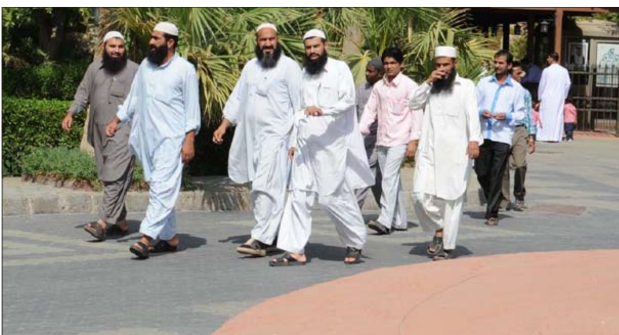
إقبال من الجاليات الوافدة على زيارة الحديقة