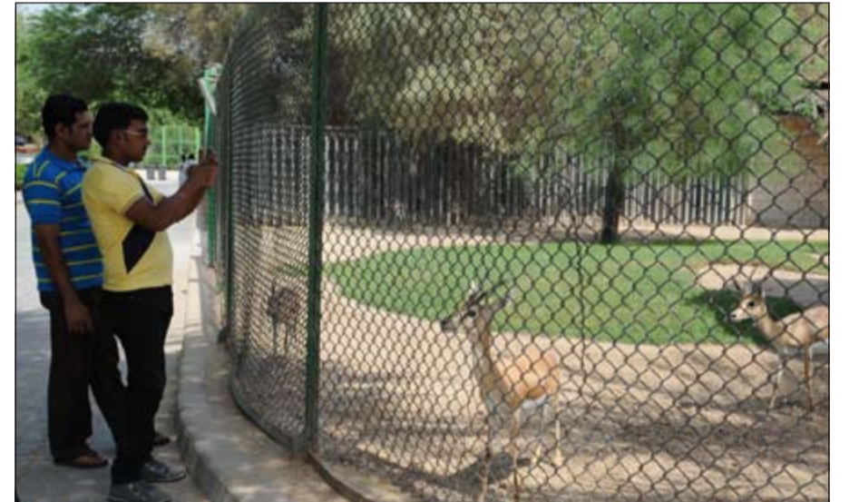
الغزلان بانتظار الطعام

وبين أن الإقبال الذي شهدته الحديقة في يومها الأول كان مميّزا للغاية متوقعا زيادة أعداد الضعافا مضاعفة ثاني أيام العيد السعيد، حيث يتم الافتتاح من الساعة الثامنة صباحا وحتى الثامنة مساء، ما يعني استقبال الزوار لمدة 12 ساعة متواصلة يقضون خلالها أجمل الأوقات في التسليّة والتجول واللعب والاستمتاع بمشاهدة فصائل متنوعة من الحيوانات.