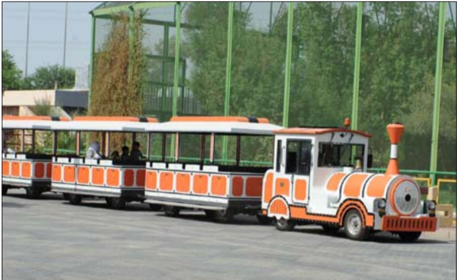
قطار الحديقة يجذب الأطفال