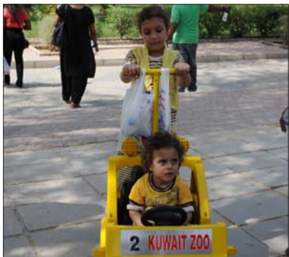
عربات خاصة للأطفال