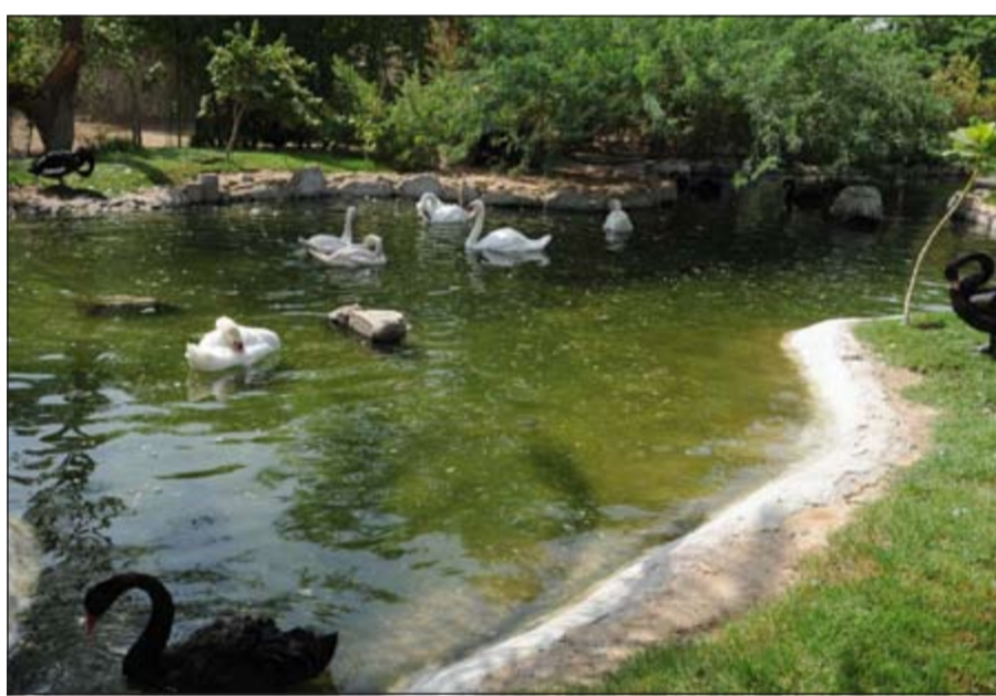
بحيرة البيط والأوز