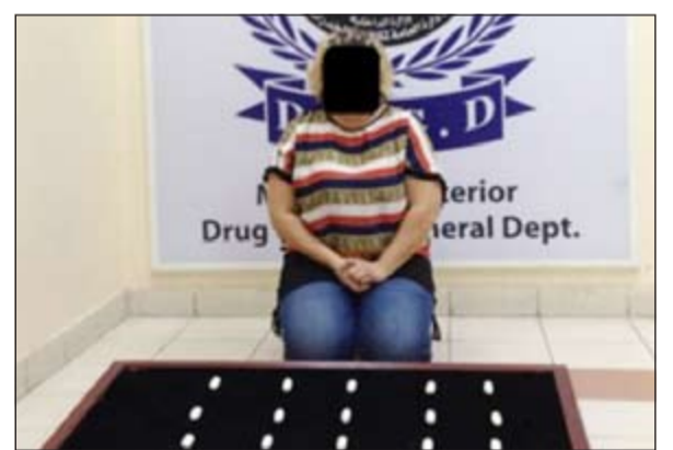
التهمة فصلت من عملها حسب بيان للداخلية

في تعقيب لإدارة الإعلام الأمني على ما نشرته بعض الصحف من ضبط إحدى المواطنات الموظفات بوزارة الداخلية بتهمة تهريب مادة الكوكايين المخدرة، أوضحت الإدارة أن المهمة التي كانت تعمل بأحد أجهزة الوزارة تم فصلها من وظيفتها منذ ما يزيد على عام مضى. يذكر أن المهمة التي تم ضبطها متلبسة بتهريب المواد المخدرة عقب وصولها من إحدى الدول العربية والعمور في ملابسها الداخلية على كمية من المواد المخدرة وتبين ان التحقيقات معها انها اعتادت على السفر لفترات قصيرة ومن ثم العودة وسط ترجيحات بانها كانت تهرب المواد المخدرة من السفر تمت احالتها مع الضبوطات الى النيابة العامة.