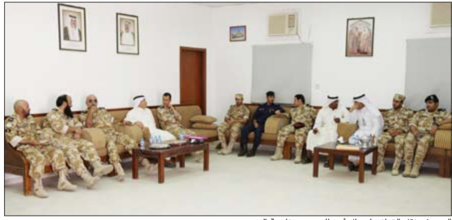
اليوسف نقل التهاني لرجال أمن الحدود بمناسبة العيد