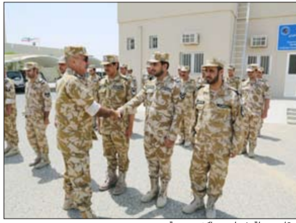
.. قام بجولة شملت مراكز حدودية