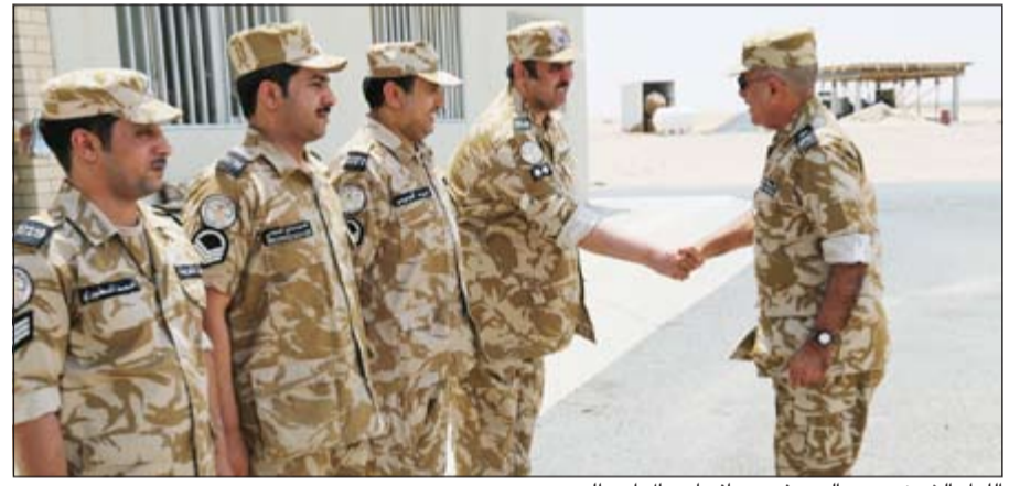
اللواء الشيخ محمد اليوسف مصافحاً رجال أمن الحدود

هؤلاء الرجال ومدى التنسيق والتعاون بين قيادات وضباط وأفراد قطاع أمن الحدود لمواجهة أي طارئ والتعامل معه بكفاءة واقتدار إضافة إلى سعيهم الدائم لتطوير العمل والتدريب المتواصل واستخدام نظم التكنولوجيا الحديثة التي وفرتها الدولة لمساعدتهم على ضبط الحدود ومراقبتها.