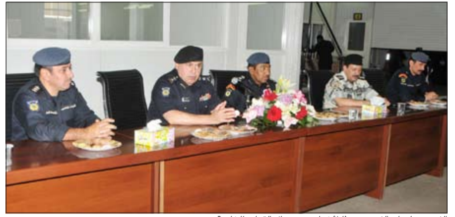
الفريق سليمان الفهد يتحدث لأخوانه من رجال القوات الخاصة

زيارة الفريق سليمان الفهد التي تؤكد دعم قيادات الوزارة لرجال الأمن والتواصل معهم في أول أيام عيد الفطر السعيد معتبرين هذه الزيارة دافعا للاستمرار بمواصلة العمل بنفس القدر من الدقة والانضباط.