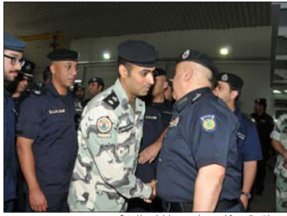
.. ويتلقى التبريكات من أحد ضباط أمن المنشآت