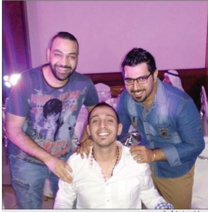
صورة تجمع فريق البرنامج