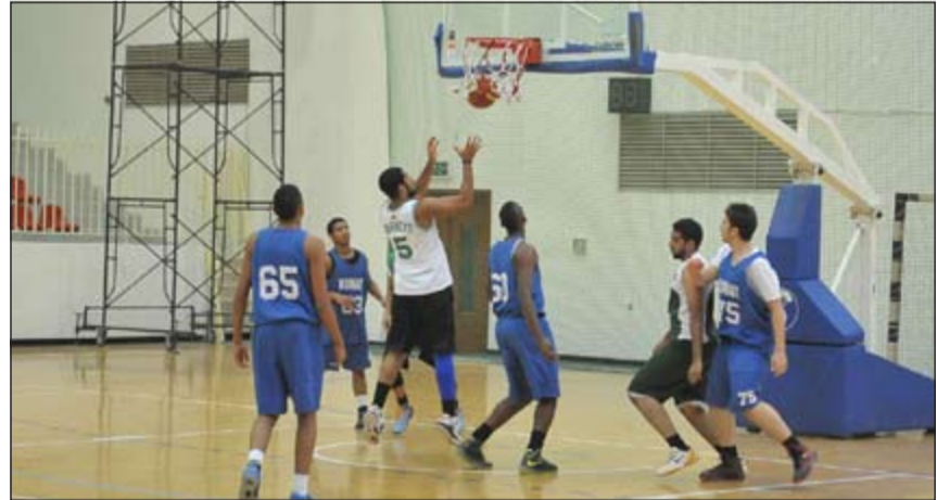
مواجهة مفيدة للشباب العربي

الـ 16 المستدعين للقائمة الاولى وذلك للوقوف على مستوياتهم.