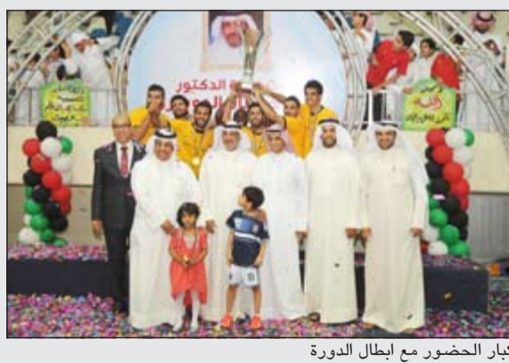
كبار الحضور مع ابطال الدورة

توج فريق فهد ناصر الدوسري بلقب النسخة الثالثة لدورة المرحوم مساعد الدوسري الرمضانية لكرة الصالات بتغلبه في المباراة النهائية على فريق منتخب شباب الكويت بثلاثية نظيفة في ختام الدورة التي شهدت مشاركة 32 فريقا وأقيمت برعاية النائب السابق د. بادي الدوسري.