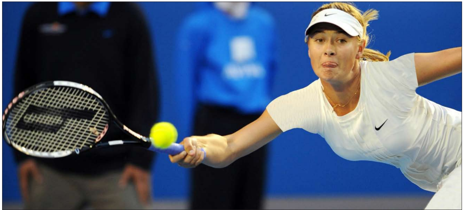
شارابوفا الاغلى بين الرياضيات

– للهجوم: كريستيانو رونالدو (ريال مدريد) ولويس ناني (مان الانجليزي) وفاريلو (بورتو) وهيلدر بوستيغا (سرقسطة الاسباني) ونيلسون اوليفيرا (رين الفرنسي) وداني زينيت سان بطرسبورغ) وفيرينيا (فولفسبورغ الالماني)