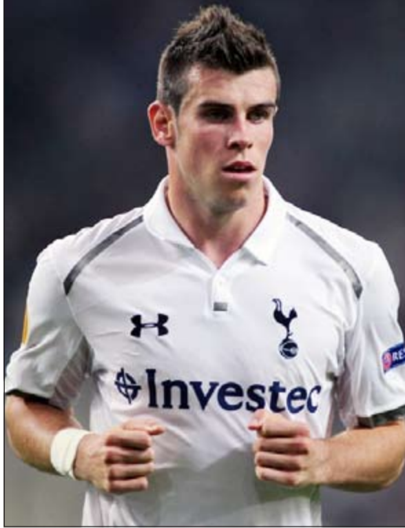
توتنهام مجبر على التخلي عن غاريت بايل

اعتبر مدير نادي توتنهام الانجليزي لكرة القدم كيث ميلز ان ناديه لا يستطيع ارغام المهاجم الدولي الويلزي غاريت بايل على البقاء رغما عنه. وقال ميلز في تصريح لصحيفة محلية: «اننا نرغب جدا جدا في بقاء بايل، لكن النادي لا يستطيع ارغامه على ذلك خلافا لرغبته».