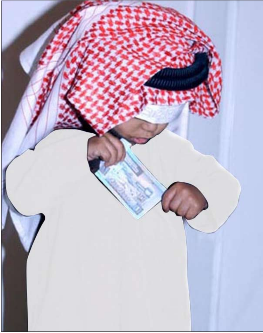
وناسة الأطفال بالعيدية تكمل فرحتهم بالعيد