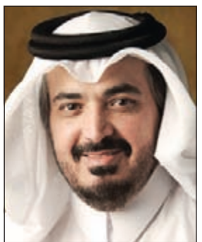
الشيخ عبدالله بن محمد آل ثاني

ولقد أتاحت لنا القوة أعلنت «العربية للطيران» أول وأكبر شركة طيران اقتصادي في الشرق الأوسط وشمال أفريقيا، امس عن نتائجها المالية للفترة المنتهية في 30 يونيو 2013، والتي تعكس مدى نجاح قوة نموذج أعمال الشركة، وتحققها لأرباح متواصلة خلال النصف الأول من العام الحالي. وارتفعت الأرباح الصافية لـ «العربية للطيران» خلال الأشهر الستة الأولى من العام الحالي لتصل إلى 134 مليون درهم، بزيادة نسبتها 17٪ مقارنة بالأرباح الصافية للفترة ذاتها من العام الماضي. وسجلت «العربية للطيران» خلال النصف الأول من العام الحالي إيرادات إجمالية بلغت 1,5 مليار درهم، ما يمثل زيادة بنسبة 19٪ مقارنة بإيرادات الفترة ذاتها من العام 2012 والتي بلغت 1,2 مليار درهم. كما ارتفعت الأرباح الصافية لـ «العربية للطيران» خلال الربع الثاني من العام متجاوزة بذلك توقعات المحللين لتصل إلى 134 مليون درهم، بزيادة نسبتها 15٪ مقارنة بالأرباح الصافية التي سجلتها الشركة