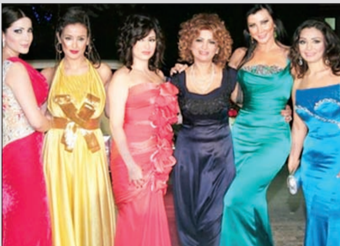
مسلسل «صبايا 5»

من الصعب القول عن مسلسل «صبايا 5» انه عمل درامي اذ ان ما نشاهد عبارة عن عروض ازياء متلاحقة لنجمات العمل مع المكياج الصارخ وسط غياب الأداء الجيد من هبه نور، ليليان اطرش، ستيفاني سالم، نادين ويلسون نجيم وجيني اسبر التي تعاني من تعثرها الدائم في مخارج الحروف.