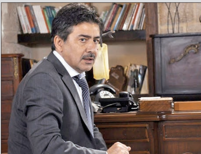
عابد فهد في «لعبة الموت»

تميز عابد فهد في مسلسل «لعبة الموت» الذي يعرض على قناة ابوظبي بأداء متقن لدرجة ان سيرين عبدالنور قالت انه كان يخيفها أحياناً بسبب جديته العالية في الأداء وتقمصه الدور وكذلك تميز الممثل ماجد المصري في العمل الذي تميز بالمزيج اللبناني المصري في الحوار والأداء والتمثيل.