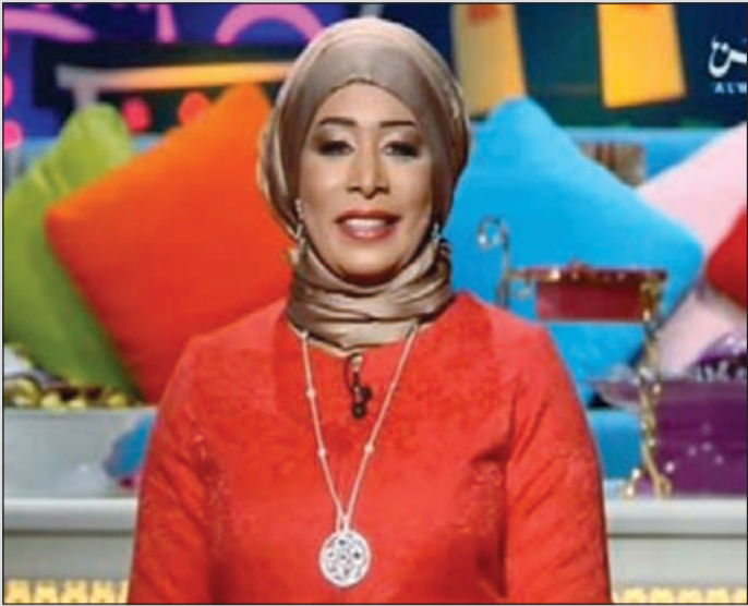
الاعلامية الممثلة ايمان نجم