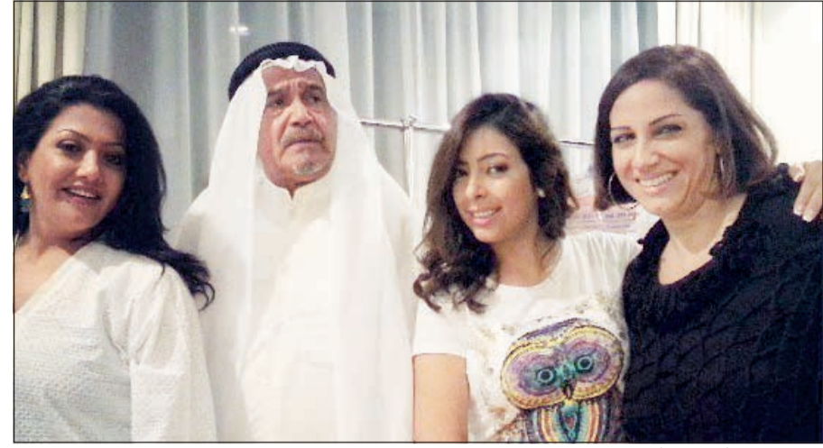
مشهد من مسلسل «مخال»