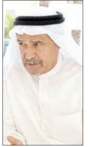
الفنان القدير جاسم النبهان

المسلسلات تعبر عن هموم الناس وتقدم قضايا تلامس الواقع، مشيداً بمسلسل «العراف» للنجم عادل امام وحيكته الدرامية واداء «الزعيم» فيه، وايضا بدور الفنان صلاح السعدني في مسلسل «القاصرات» والرسالة التي قدمها من خلال العمل. واشاد الفنان القدير بمسلسل «الملاعق» قائلاً: هذا العمل الكويتي يحمل بانورا اما جميلة تدور حول المثقف الكويتي وعلاقته بالعالم العربي وهموم الشارع، قبل ان يضيف: تجربة «الملاعق» ناجحة لكاتب يؤلف لأول مرة ومخرج هذا اول اعماله، متمنيا ان تكون مسلسلات تلفزيون الكويت كلها تقدم حلولاً للمشكلات التي تواجه