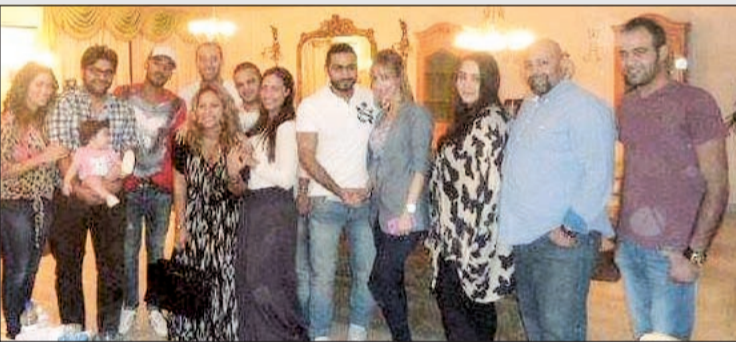
تامر حسني وزوجته في حفل الإفطار

شارك الفنان تامر حسني وزوجته بسمة بوسيل في حفل إفطار أقامته الفنانة راندا حافظ في منزلها. وحضر الحفل عدد من أصدقاء الفنان، والتف مجموعة من معجبي تامر حوله ليلتقطوا بعض الصور معه هو وزوجته، حيث يعد ذلك هو الظهور الأول لهما معا بعد إنجاب طفلتهما «تاليا». واللافت، حسب موقع «محيب»، ان بسمة ظهرت وقد استعادت رشاققتها بعدما فقدت الكثير من وزنها الزائد، بسبب الحمل والولادة.