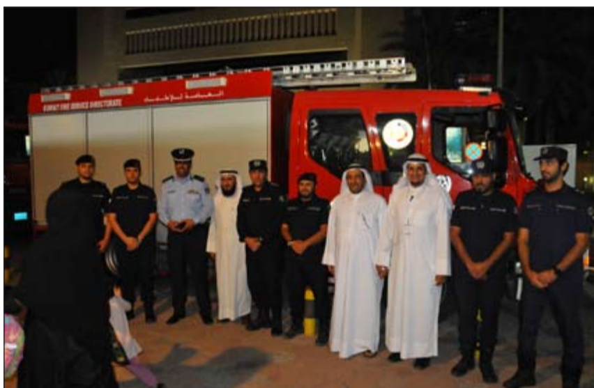
عمادي متفقد الطوارئ الطبية

وأضاف أن شهر رمضان هو بمنزلة جامعة شروط القبول فيها الإيمان والاحتساب ومن حقق هذين الشرطين قبل في الجامعة وبعدها تبدأ رحلة هؤلاء المقبولين بهذه الجامعة وهل دخلوا جميع الكليات في هذه الجامعة وهكذا يتنوع الناس في هذه الجامعة ولهذا علينا تدبر ما في هذا الشهر وأن يكون العمل خالصا لله وإن كان الإخلاص له عدة محاور فهناك الإخلاص في العمل والصدقة والدعاء والنية بالإضافة إلى ضرورة التحلي بالصبر في أداء هذه العبادات.