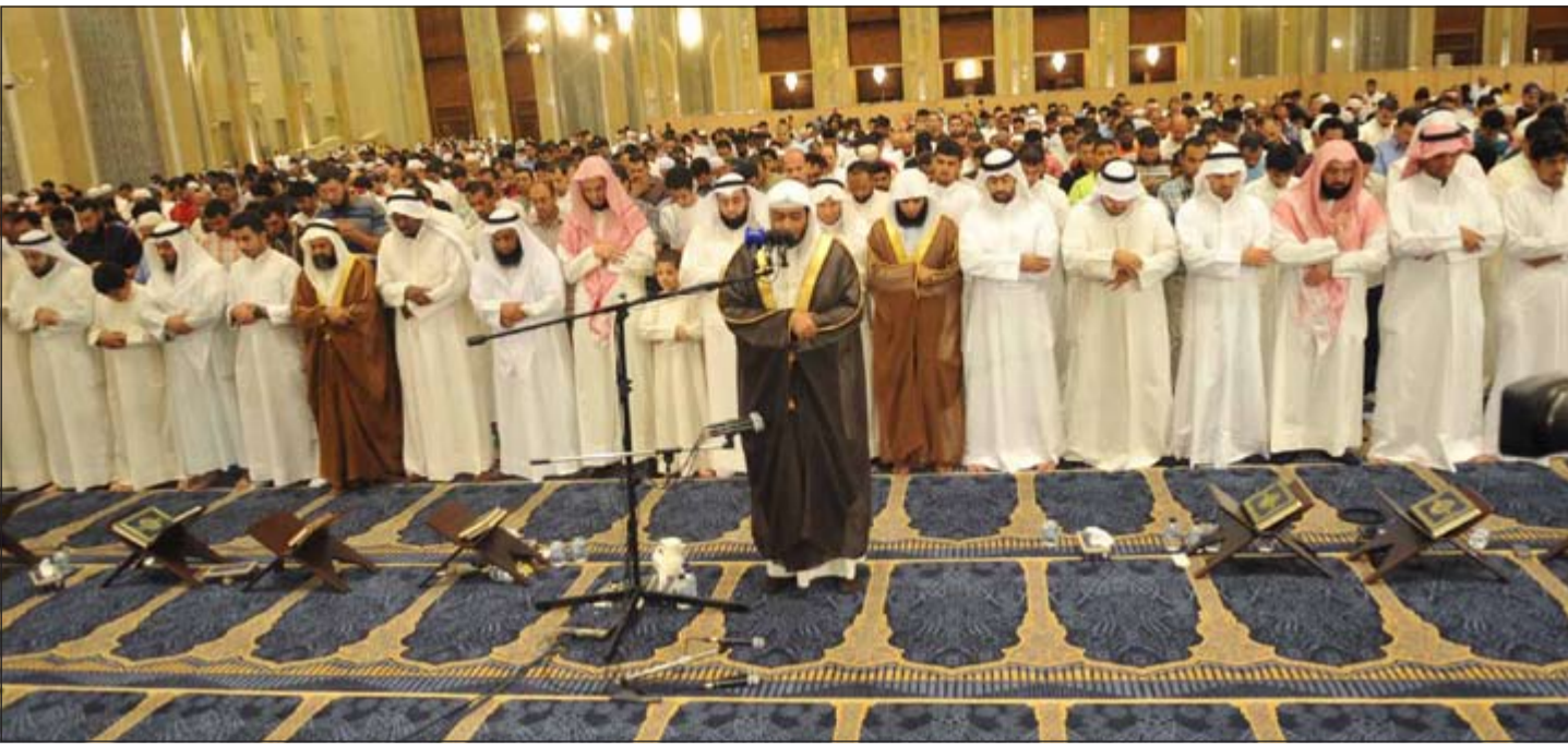
آلاف من المصلين في المسجد الكبير ليلة 28 من رمضان