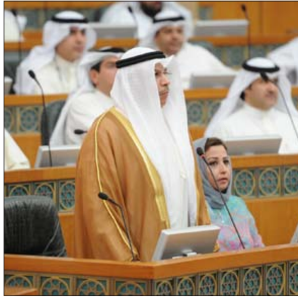
الشيخ خالد الجراح

بعث صاحب السمو الأمير الشيخ صباح الاحمد ببرقيات تهنئة الى اعضاء مجلس الأمة الذين فازوا بعضوية لجان المجلس. وتمنى سموه للجميع كل التوفيق والسداد للاسهام في خدمة الوطن العزيز ورفعته رايته. كما بعث سمو ولي العهد الشيخ نواف الاحمد ببرقيات تهنئة الى اعضاء مجلس الأمة الذين فازوا بعضوية لجان المجلس، متمنيا سموه للجميع كل التوفيق والسداد. وبعث سمو رئيس مجلس الوزراء الشيخ جابر المبارك ببرقيات تهنئة مماثلة.