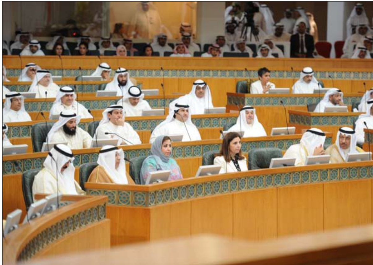
جانبة من جلسة أمس