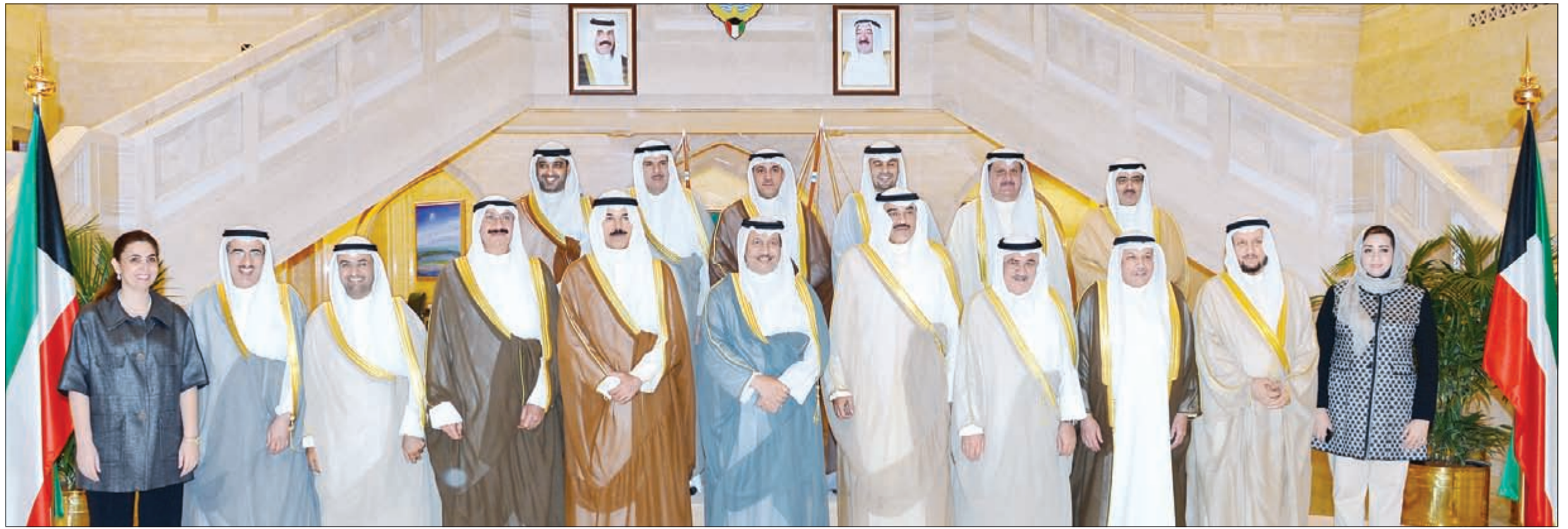
سمو رئيس الوزراء الشيخ جابر المبارك متوسلا الوزراء في لقطة جماعية