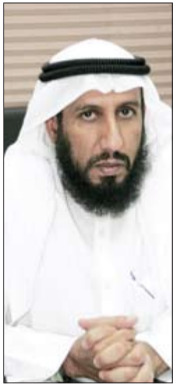
الداعية خالد الخراز