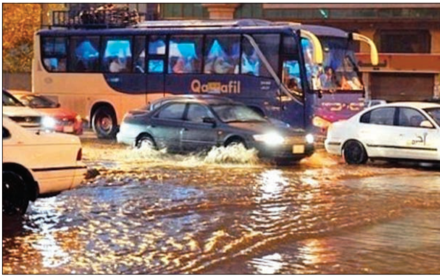
أمطار الخير في مكة