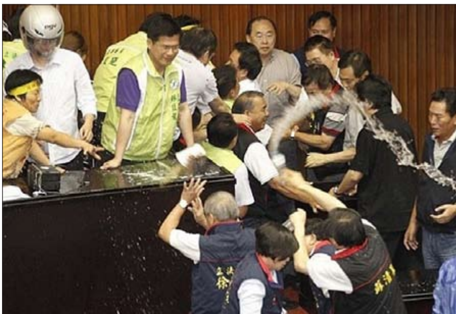
عراك في البرلمان التايواني

حدثت من هذا النوع في البرلمان التايواني، وكان آخرها في 25 يونيو الفائت مع الصين.