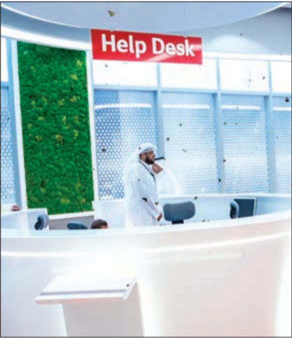
قسم خدمة العملاء في الدور الأرضي