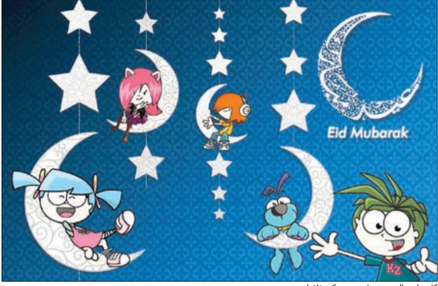
كل عام والجميع بخير من «كيدزانيا»

كما ستحرص مرافق ومنشآت الفعاليات الإعلامية في المدينة على تغطية هذه المناسبة المناسبة السعيدة بدورها، حيث سيقوم «مذيعو الإذاعة»، بث آخر أنباء احتفالات العيد من خلال استديو الإذاعة، وسيعمل «صحافيون الصغار» على تغطية هذه الأخبار في الجريدة اليومية التي تصدر في مدينة كيدزانيا الكويت.