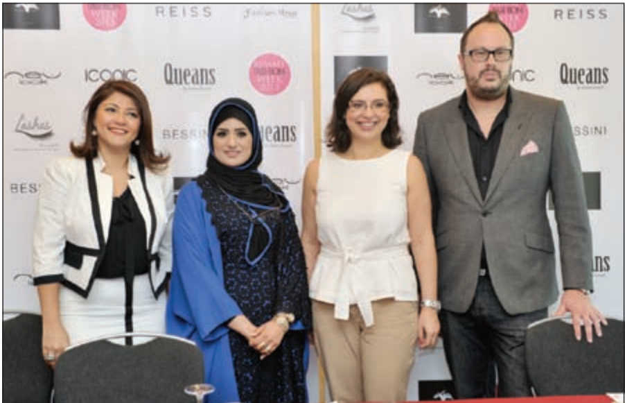
مشاركين في المؤتمر

والتي سيتم عرضها في عرض الأزياء الذي سطره فيه تشكيلة رمضان وعيد الفطر. وذكرت البيرتا من ريس، «أن ريس العلامة البريطانية تأسست عام 1971 كمحل للرجال».