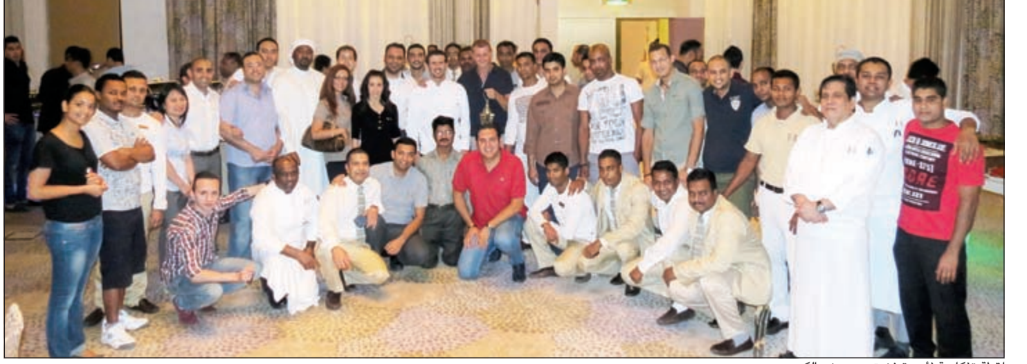
لقطة تذكارية لأسرة فندق ميسوني الكويت

الرمضاني، وقام المدير العام بتحية موظفيه بالمرور على موائدهم وتهنئتهم والتصوير معهم.