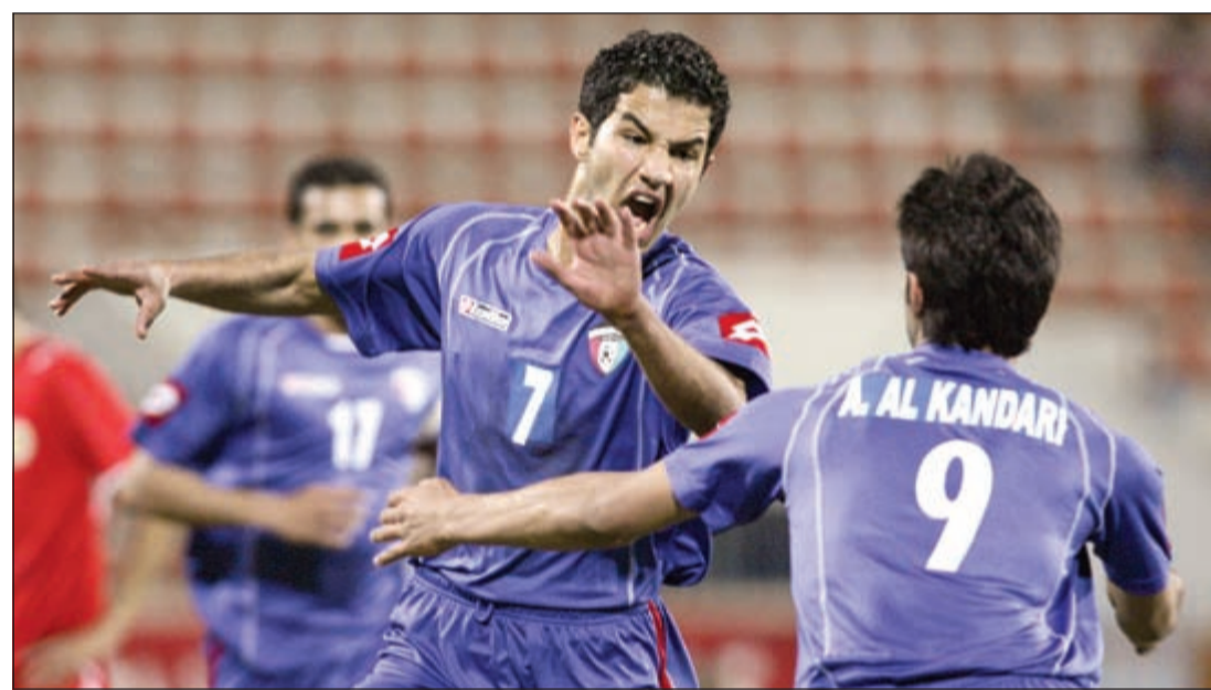
العنزي يريد استعادة مستواه من أجل العودة للعب مع الأزرق