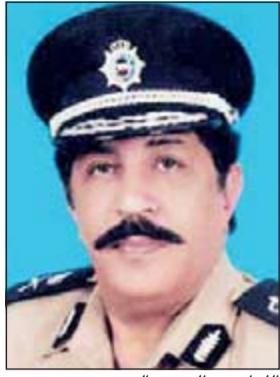
اللواء عبدالحميد العوضي