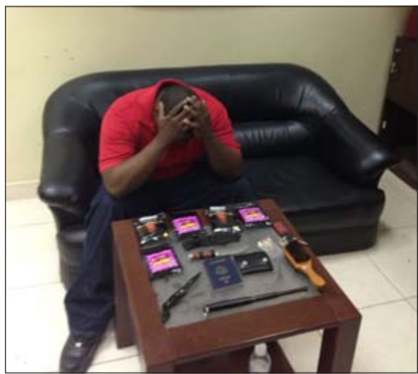
الأميركي في مديرية أمن حوли قبل إحالته إلى «المكافحة»