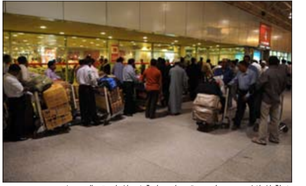
خطة المنافذ تعتمد على تحقيق انسيابية في المغادرة والوصول

عبر خطة لتسهيل التنقل ووسط توقعات باستقبال المنافذ لربع مليون شخص