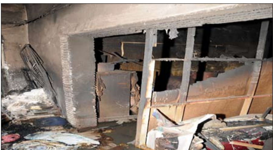
الخشائر اقتصر على مادية دون إصابات بشرية

كان محشورا داخل الشقة المحترقة، كما قامت فرقة المكافحة بمكافحة وإخماد