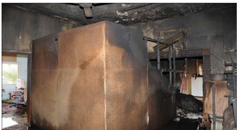
الحريق كشف عن فواصل اقامها الاسوييون بصورة غير قانونية

الدخان المنتشر داخل العمارة والثانية لمكافحة النيران، حيث قامت فرقة الإخلاء