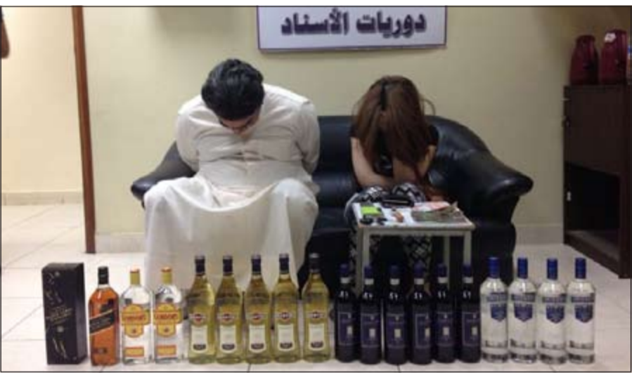
الإيرانية والمواطن وأمامهما المضبوطات