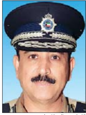
اللواء عبدالله المهنا