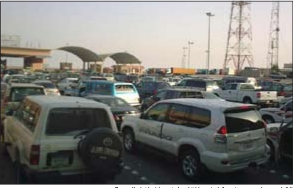
الكانترات تعمل بكامل طاقتها في المنافذ البرية