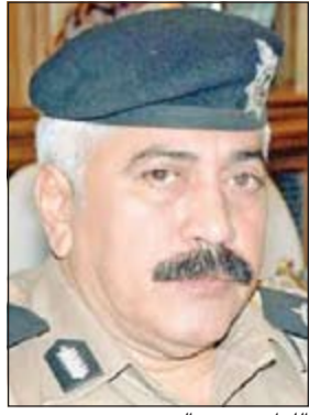
اللواء محمود الدوسري