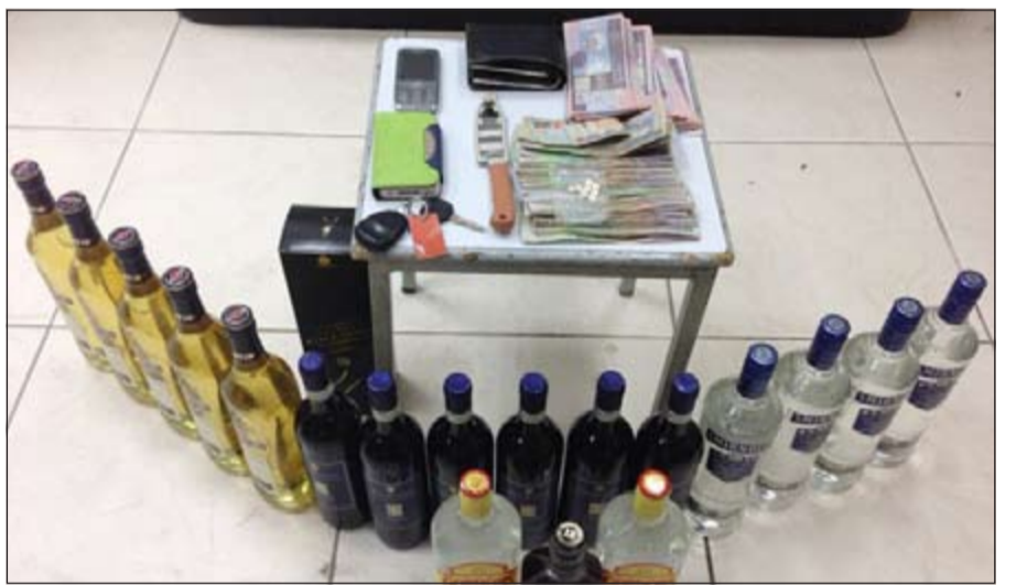
الخمور المضبوطة بحوزة المطلوب وتبدو المبالغ المالية التي ضبطت بحوزته والحبوب