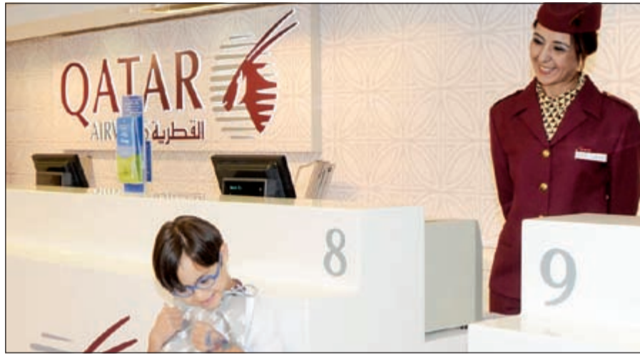
مشاركة من الخطوط القطرية في اليوم الترفيهي