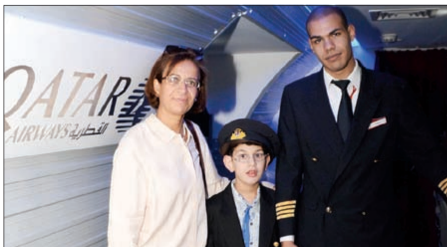
... ومع الكابتن

دعت الخطوط الجوية القطرية عددا من أطفال الجمعية الكويتية لرعاية الأطفال في المستشفيات ومركز الخرافي لأنشطة الأطفال المعاقين لقضاء يوم ترفيهي في قرية كيدزانيا للأطفال بمركز أكينيون للتسوق بالعاصمة الكويتية.