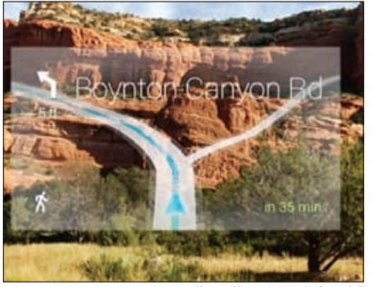
الطريق كما يبدو من خلال «نظارة غوغل»

لندن - وكالات: تدرس وزارة النقل في المملكة المتحدة إصدار قرار يقضي بمنع سائقي المركبات من ارتداء «نظارة غوغل» أثناء القيادة، حسب ما أكد الناطق باسم وزارة النقل البريطانية. يأتي هذا في خطوة تسبق طرح غوغل لنظارتها الذكية بشكل رسمي للبيع في الأسواق. ويهدف القرار المزمع إصداره إلى منع أي تشويش قد يتعرض له السائق بسبب ارتدائه النظارة أثناء القيادة، حيث أكد الناطق باسم وزارة النقل البريطانية أن نقاشات عديدة قد جرت بين الوزارة والشرطة منذ الإعلان عن «نظارة غوغل»، بغرض منع ارتدائها أثناء قيادة المركبات لما قد تسببه من تشويش للسائق. ويعتقد أن يسبب القرار في حال صدوره استياء العديد من المهتمين باستخدام التقنيات الحديثة في حياتهم اليومية، حيث تؤمن «نظارة غوغل» إمكانية عرض الخرائط والاتجاهات أثناء قيادة المركبة دون الحاجة للنظر إلى شاشة جانبية.