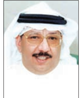
الشيخ محمد جراح الصباح

النتائج تعكس بصورة مباشرة الأداء الجيد للبنك في تحقيق أهدافه الإستراتيجية لهذا العام، والتي تم تحديثها وفقاً لظروف السوق والتحديات التي يواجهها الاقتصاد المحلي خلال عامي 2012 و 2013، حيث نجح الدولي خلال النصف الأول من عام 2013 في تنويع مصادر إيراداته، فقد ارتفع بند الأرباح والعمولات بنسبة 33٪، وبند الصرف الأجنبي والإيرادات الأخرى بنسب ملحوظة، وارتفعت إيرادات الاستثمار بنسبة 98٪، كما ارتفع صافي إيرادات عمليات التمويل بنحو 31٪، وقد انعكس هذا الأداء الجيد إيجابياً على المؤشرات الرئيسية الأخرى في نهاية