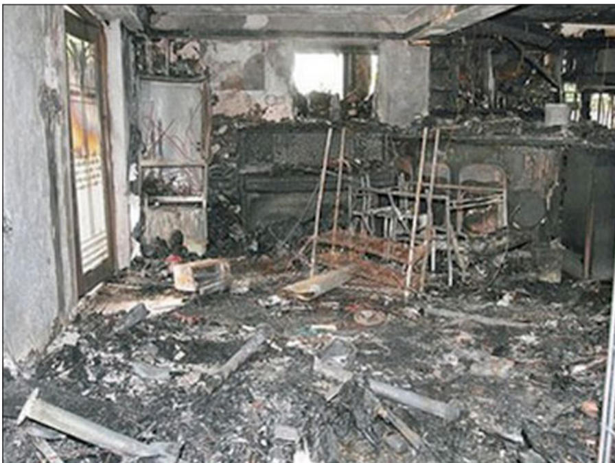
البيت بعد احتراقه

نحو 30 دقيقة كاملة لإخمادها. وأكد رجال الإطفاء: أنه لا توجد أي شبهة جنائية في هذا الحادث، وأن تحقيقاتهم اكتشفت أن السبب الأساسي هو حريق الأريكة الناجم عن انفجار الهاتف.