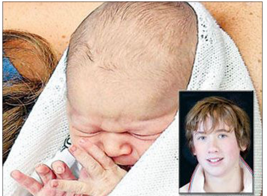
صورة تخيلية للأمير الصغير مراهما