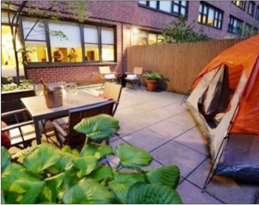
النوم في العراق

بجد ذاتها. وفي ظل ناطحات السحاب العملاقة في ميدتاون، يقدم أحد الفنادق إلى الزبون، مقابل حوالي 1995 دولارا في الليلة الواحدة، غرفة «خمس نجوم» مفتوحة في الطابق السابع عشر مع سرير ضخم وعشاء على ضوء الشموع ومدفاة ووجبات خفيفة لذينة وتلصق عملاق لمراقبة «نجوم» المدينة الفريدة من نوعها التي لا تنام.