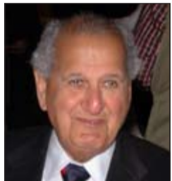
سليمان عبد الرزاق المطوع

فقدت الكويت الاثنين الماضي عالماً من اعلامها وأحد رموز نهضتها التربوية برحيل وزير التخطيط الأسبق سليمان عبد الرزاق المطوع الذي وافته المنية عن عمر يناهز الـ 80 عاماً. وشغل الراحل، رحمه الله، عدداً من المناصب المهمة في الدولة وكان للراحل دوره البارز أثناء الاحتفال الصدامي، إذ كان أحد أعضاء اللجنة التحضيرية لمؤتمر جدة الشعبي وأحد أعضاء اللجنة الصغيرة التي صاغت التوصيات والبيان الختامي للمؤتمر. وبهذه المناسبة الحزينة، تتقدم «الانباء» إلى آل المطوع الكرام بأحر التعازي، داعين المولى عز وجل أن يسكنه فسيح جناته ويلهم ذويه الصبر والسلوان (إنا لله وإنا إليه راجعون).