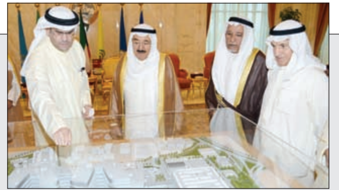
صاحب السمو الامير يطلع على مشروع المستشفى من عبد العزيز اسحق بحضور الشيخ علي الجراح والمستشار محمد ابو الحسن

الأمير اطلع على مشروع بناء مستشفى الجهراء الجديد 13