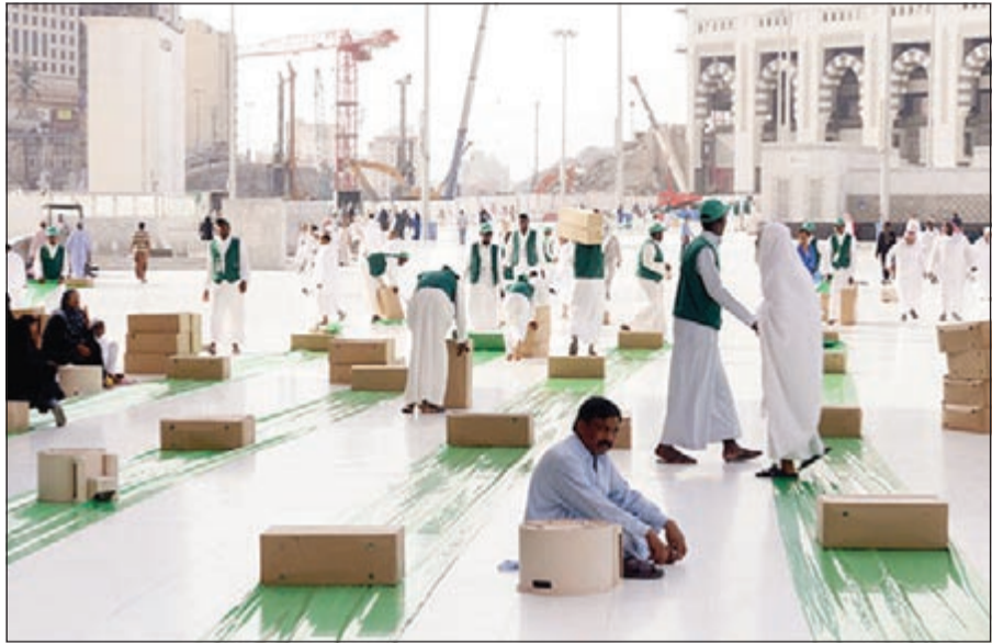
المطوعون يقومون بفرش الأرض استعدادا لوضع وجبات الإفطار في المسجد الحرام

طيلة الشهر 129 كيلومترا، علاوة على سلة القهوة والتمر التي توزع أثناء الإفطار ضمن وجبات المأدبة وتكفي لإفطار 15 شخصا. وأعلن آل طالب أنه يتم توزيع مليوني عبوة من مبرة خادم الحرمين الشريفين لسقيا الحجاج في كل عام خلال موسم الحج، إلى جانب توزيع عشرة آلاف عبوة من سقيا هدية الحاج والمعتمر يوميا.