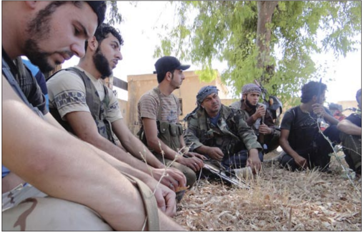
صورة لمقاتلي الجيش الحر قبل انطلاقتهم لتنفيذ عملية ضد قوات النظام في درعا قبل أيام

عواصم- وكالات: واصلت قوات النظام السوري لاحتياض حمص المحاصرة بصواريخ أرض-أرض والارجمات، فيما أعلن الجيش الحر تحقيق تقدم في دمشق والسيطرة على مواقع جديدة في حلب. وعلى هامش القصف اليومي العنيف للاحياء المحاصرة في حمص وريفها، شهدت المدينة مجزرتين متزامنتين، الأولى أسفرت عن مقتل عدة أشخاص بعد ان اصابتهم قذائف أثناء اندائهم صلاة التراويح في مسجد الحسامي بالبلدان والثانية قتلت عائلة كاملة في قصف لقوات النظام على بلدة تيرمعة.