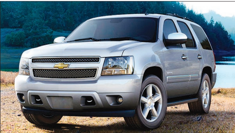
شفروليه تاهو 2013