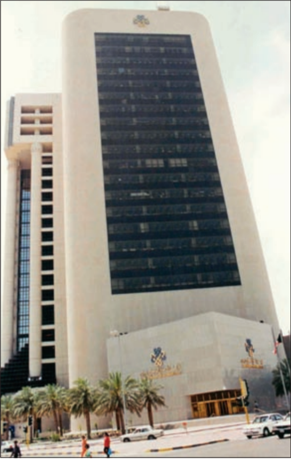
مقر البنك الأهلي الكويتي