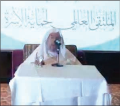
د. يوسف القرضاوي يلقى كلمته أمام الملتقى