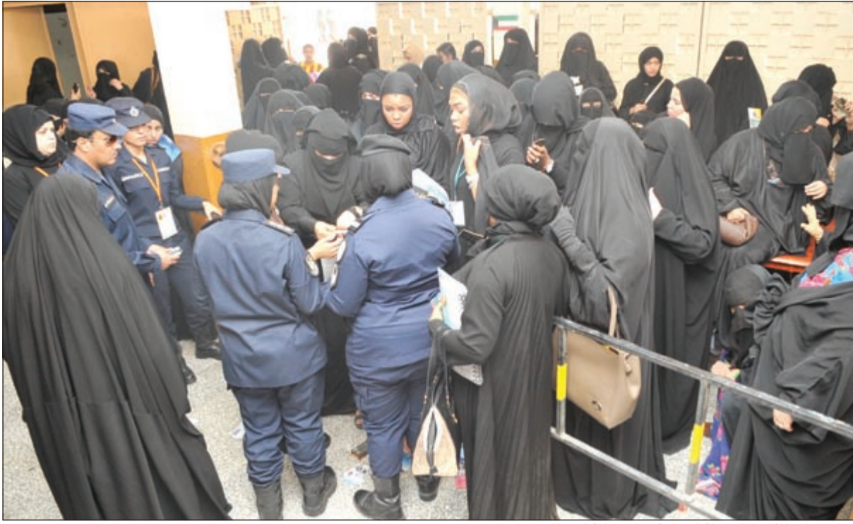
إقبال نسائي كثيف والشرطة النسائية تنظم عملية الانتخاب