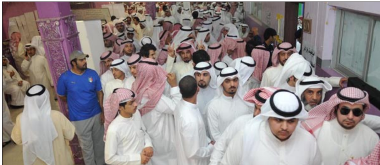
زحام شديد أمام إحدى اللجان