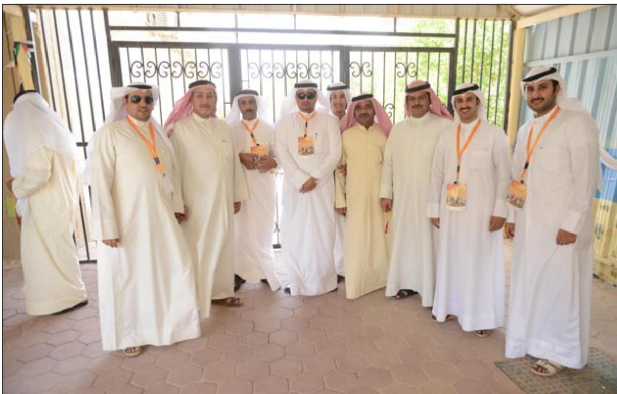
اللجنة الإعلامية لأحد المرشحين