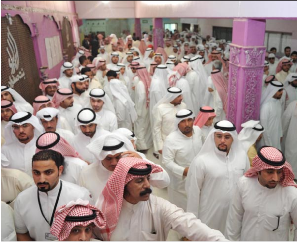
إقبال كثيف غير مسبوق على اللجان الانتخابية