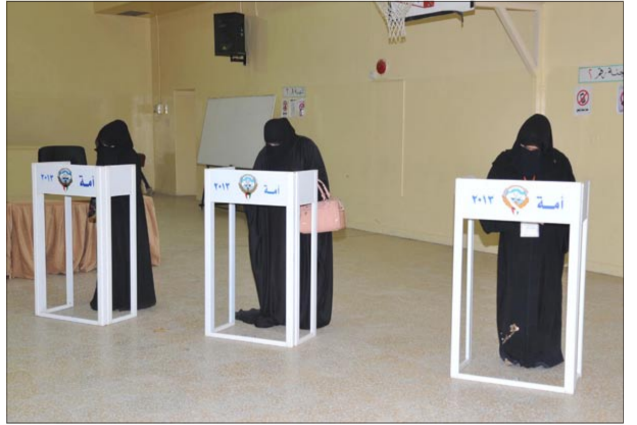
حرص نسائي على التصويت