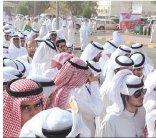
طوابير انتظار على اللجان حرصاً من الناخبين على التصويت