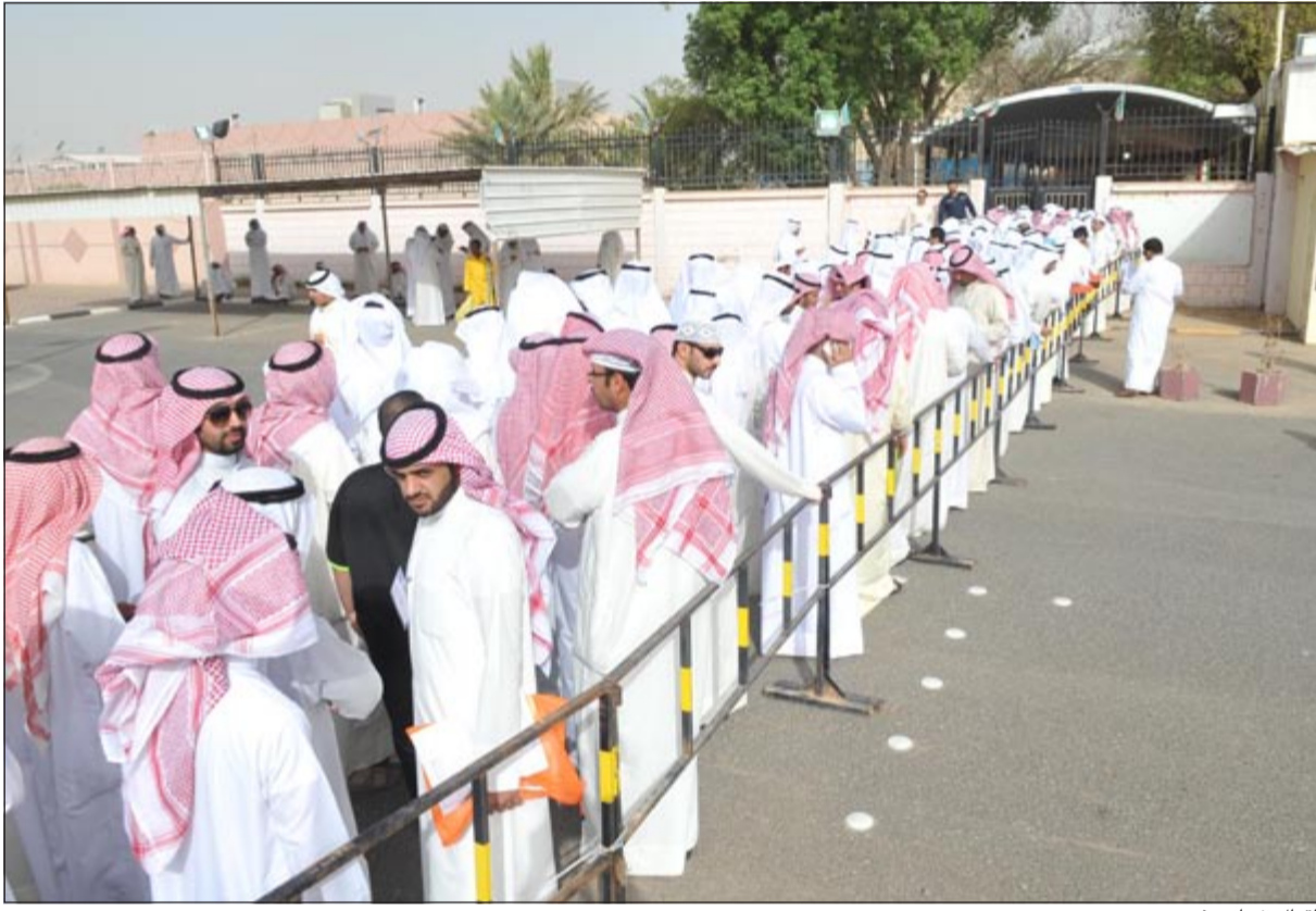
إقبال شبابي غير مسبوق