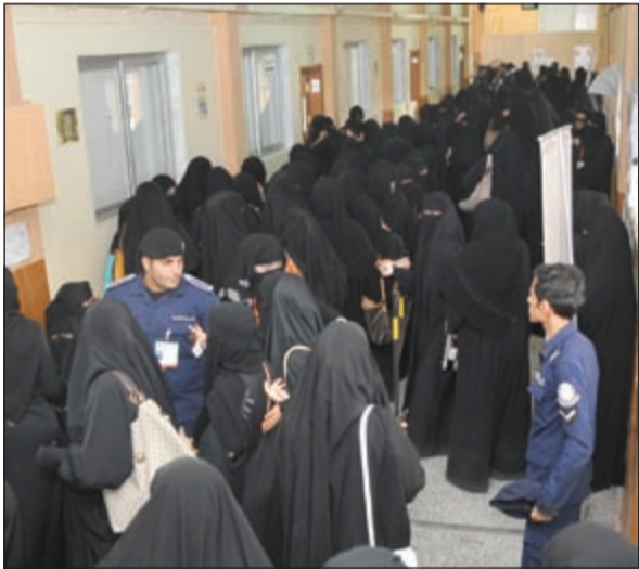
النساء حرصن على المشاركة الإيجابية وينتظرن على أبواب اللجان للتصويت

مبارك النجادة: اليوم تاريخي في تقرير مصير المرحلة القادمة لبلدنا العزيز الكويت، مرأهنا على ادراك الشعب وحسبهم العالي للمسؤولية في اختيار الاصلح.