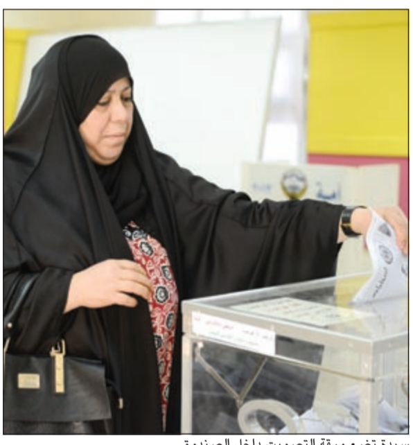
سيدة تضع ورقة التصويت داخل الصندوق