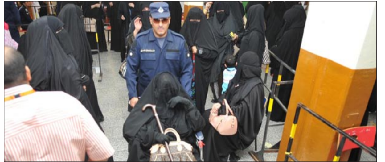
الشرطة في خدمة الشعب