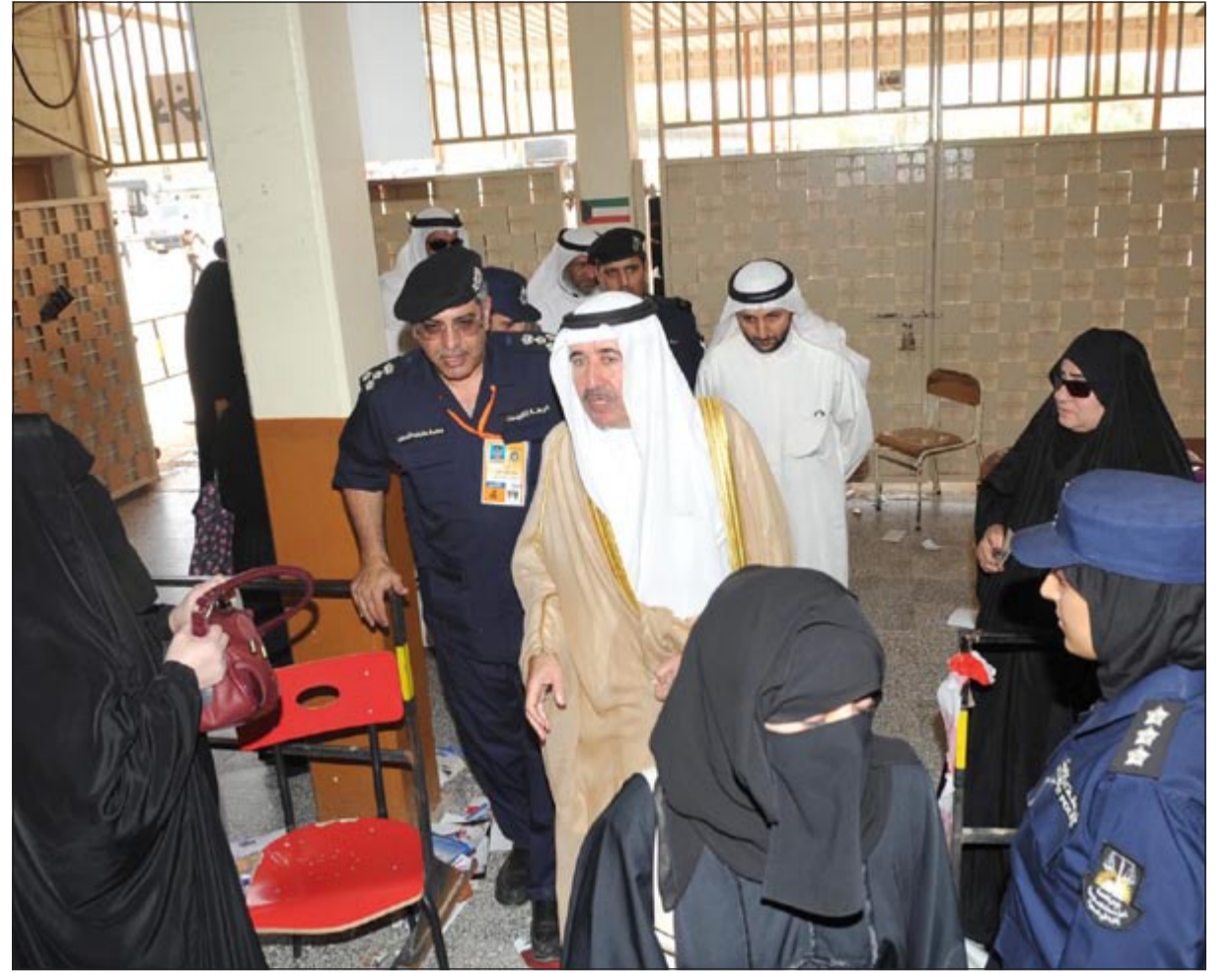
محافظ الجهراء الشيخ مبارك الحمد يتفقد لجان «الرابعة»