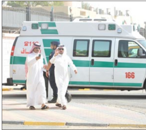
الإسعاف أمام إحدى اللجان