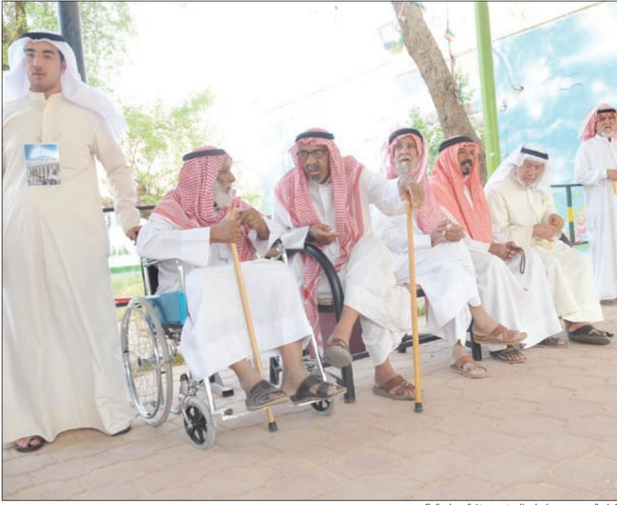
كبار السن حرصوا على الحضور منذ الصباح الباكر