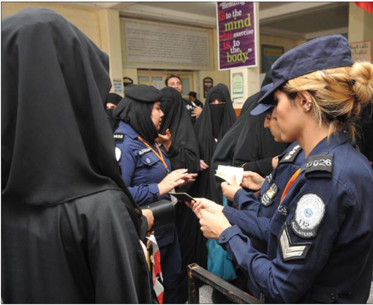
الشرطة النسائية تساعد الناخبات على المشاركة في الانتخابات