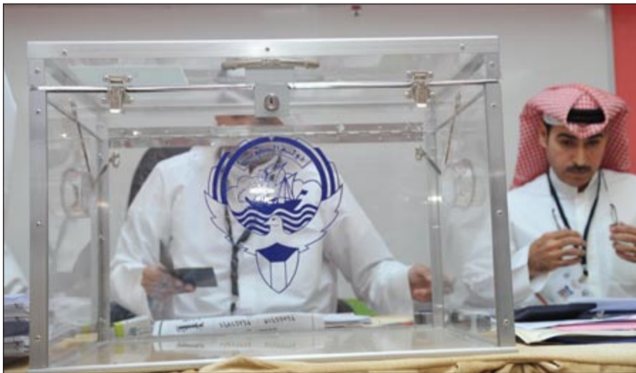
الصندوق الزجاجي بانتظار أوراق التصويت