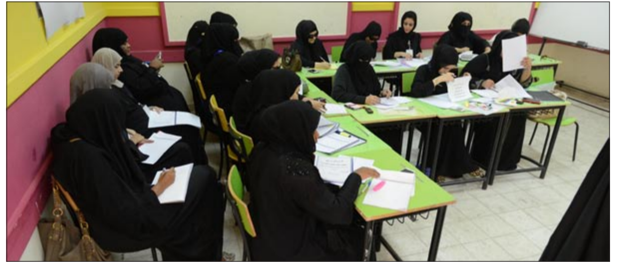
مندوبات المرشحين داخل إحدى اللجان