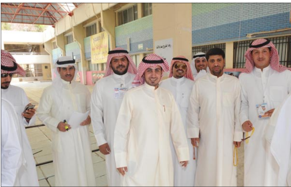
الشباب ثروة الأمم