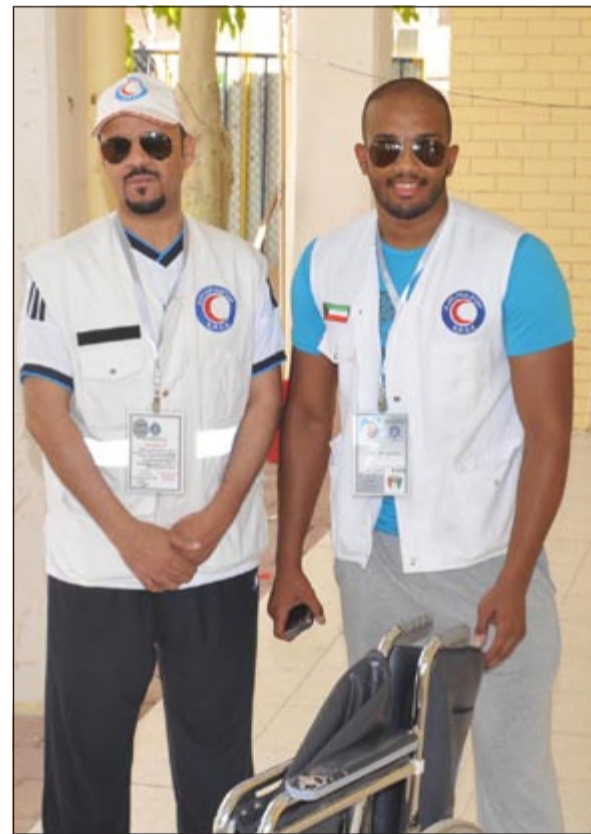
الهلال الأحمر على أهبة الاستعداد