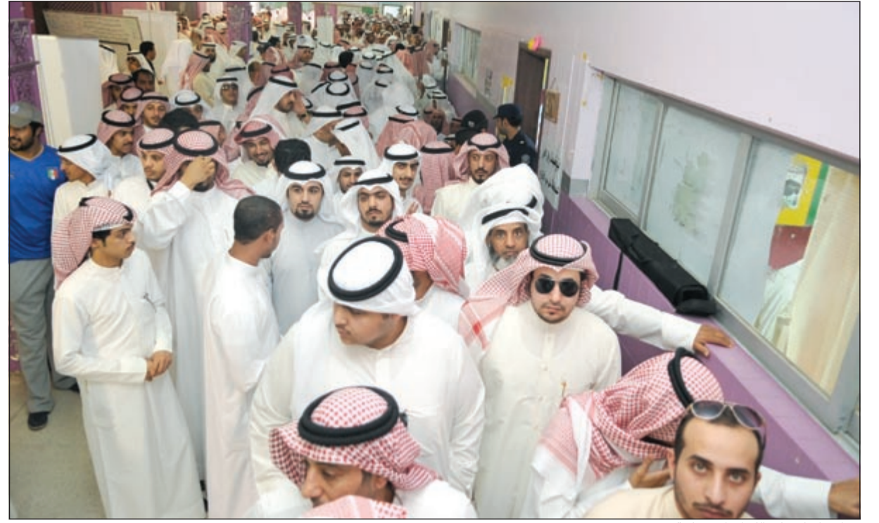
زحام وإقبال على اللجان الانتخابية

العملية الانتخابية شهدت ازدهاراً شبابياً ملحوظاً في الساعات الأولى من الاقتراع