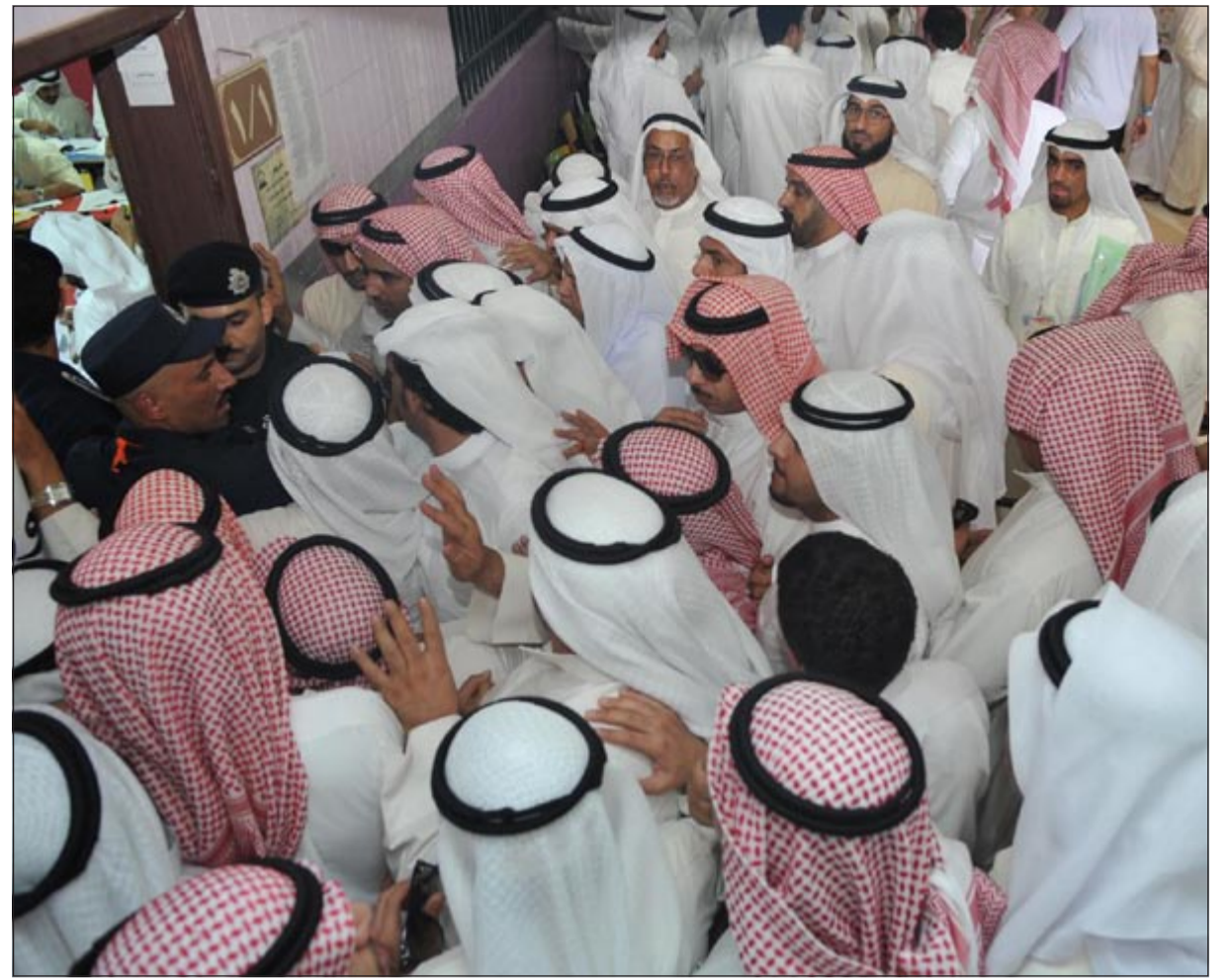
صيام رمضان لم يمنع الناخبين من الحرس على المشاركة