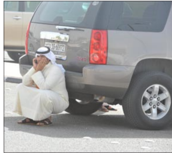
يستظل من حرارة الشمس