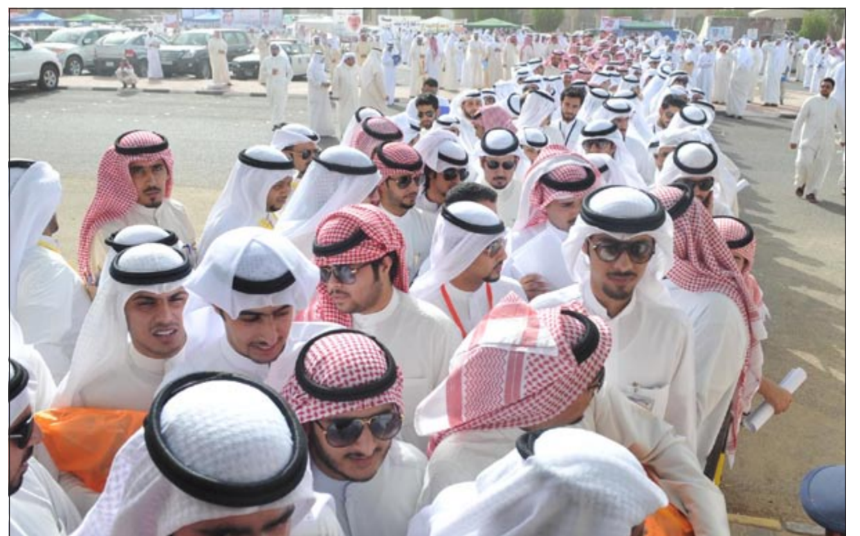
طوابير الانتظار خارج أحد المقار الانتخابية