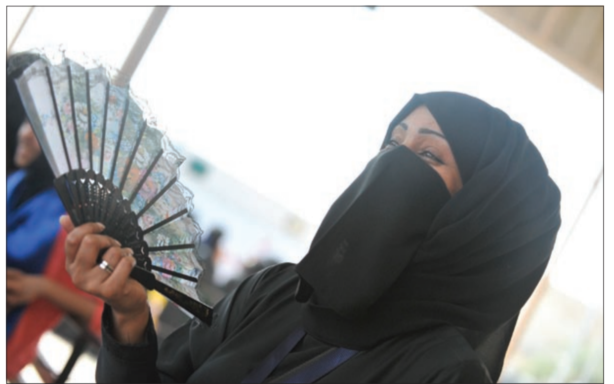
ناخبة تقاوم ارتفاع درجة الحرارة