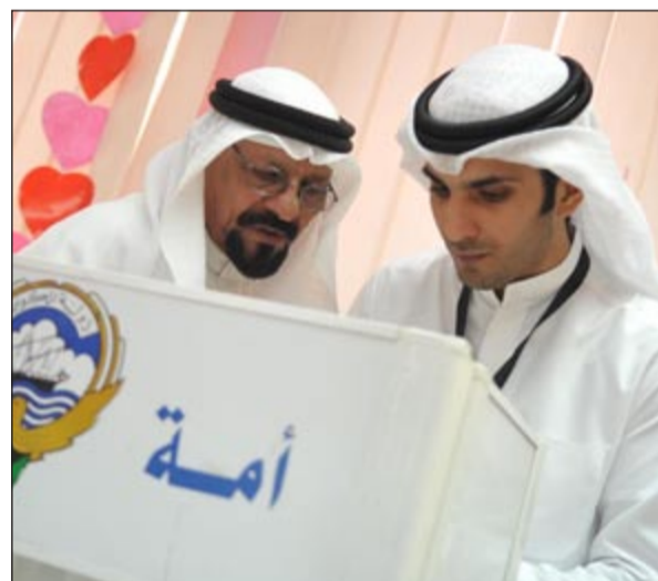
مساعدة أحد كبار السن