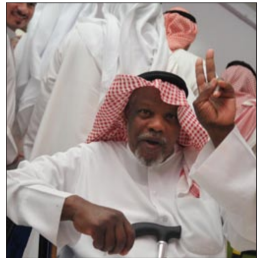
أحد كبار السن يرفع شارة النصر