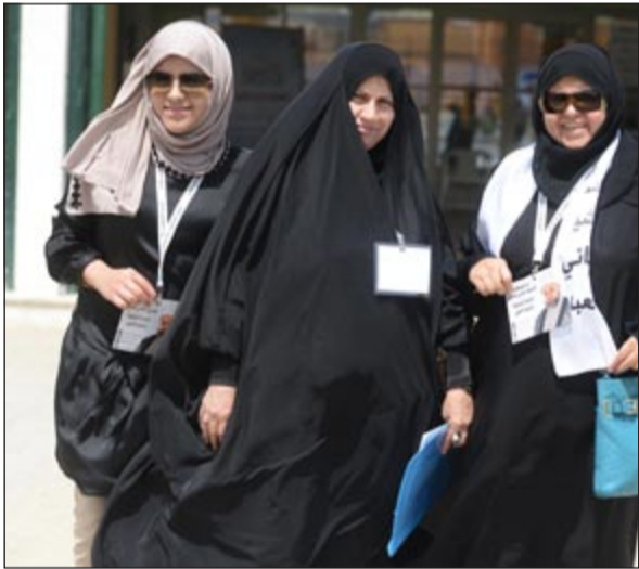
النساء ركن أساسي في الديمقراطية