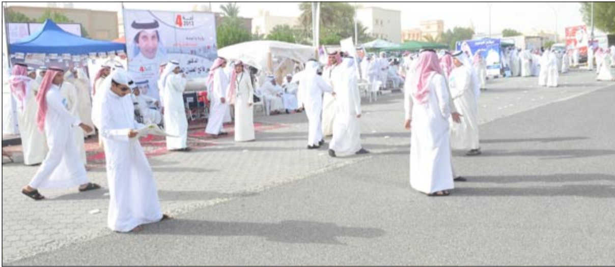
عرس ديموقراطي في شوارع الدائرة الرابعة رغم حرارة الجو