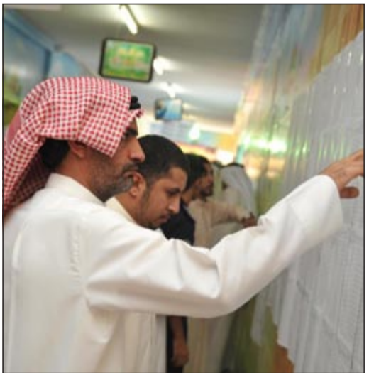
مواطن يبحث عن اسمه في جداول الكشوف