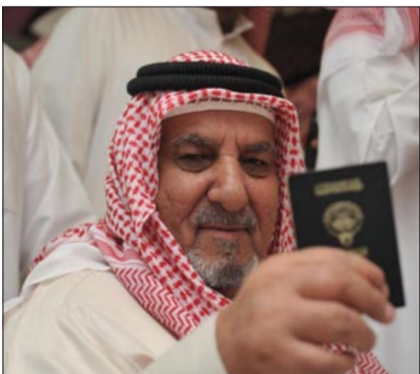
أحد كبار السن يرفع الجنسية