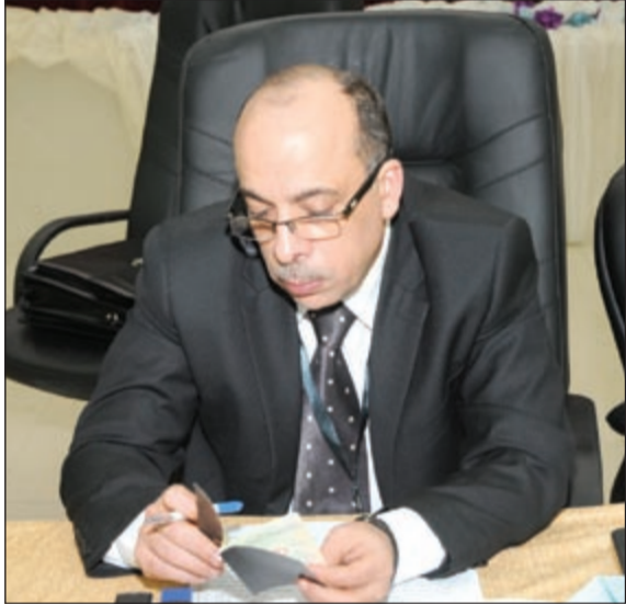
مطابقة لمعلومات الجنسية مع القيد الانتخابي