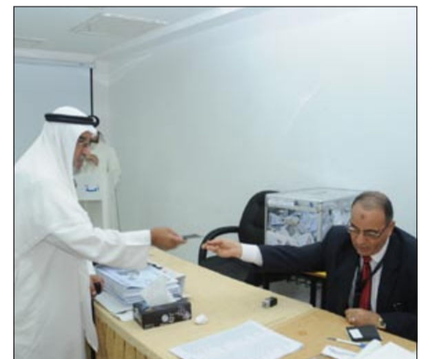
أحد كبار السن حرص على الإدلاء بصوته