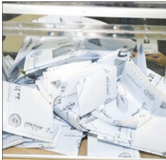
الصندوق الانتخابي الفصل بين المرشحين