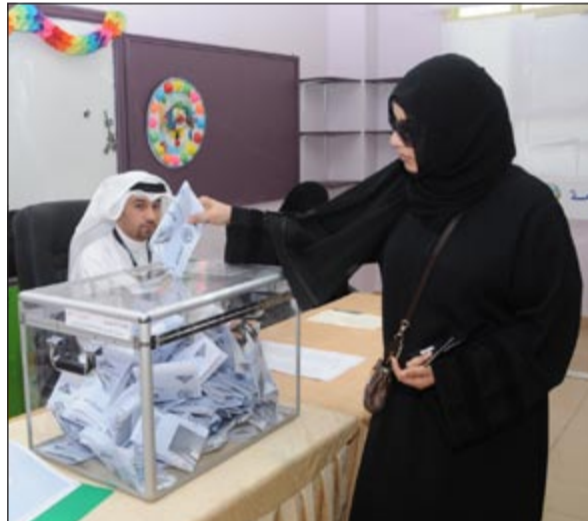
ناخبة تدلي بصوتها