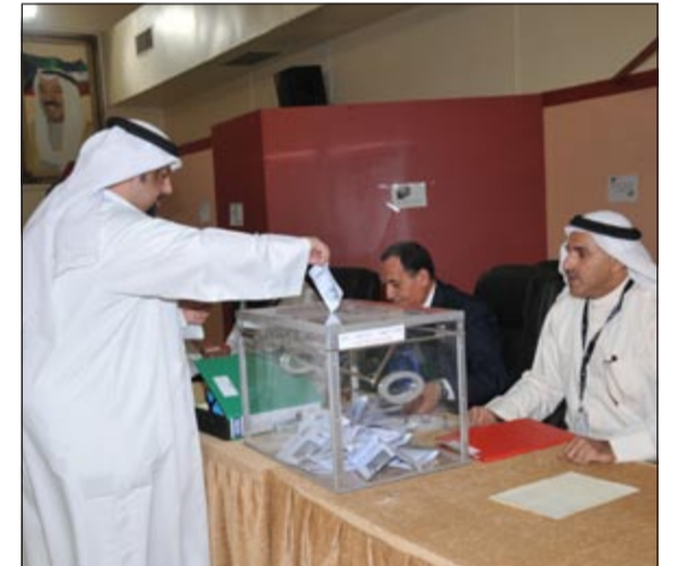
أحد الناخبين يدلي بصوته