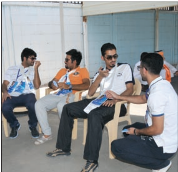
حوار بين بعض الجامع الشبابية