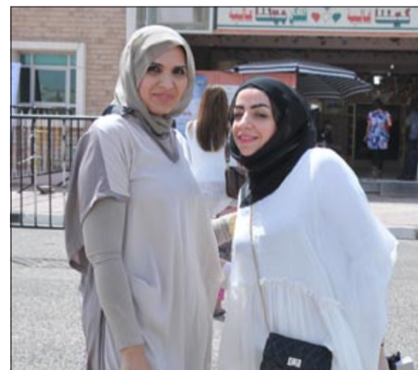
ناخبتان في الطريق للإدلاء بصوتيهما