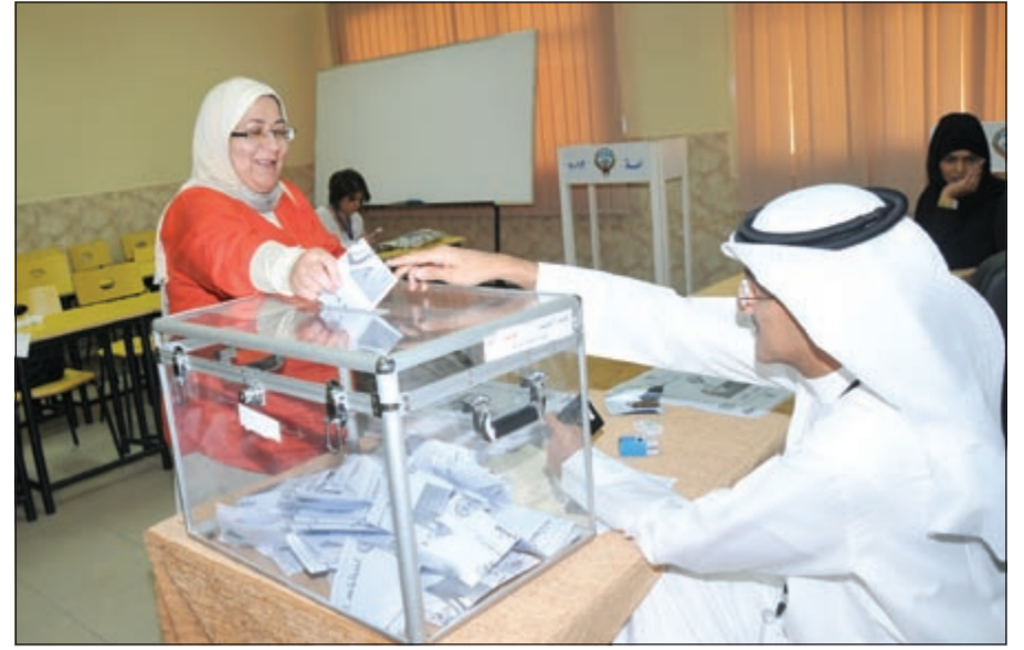
المشاركة في الانتخابات.. ايجابية

● ممثلو المرشحين أخذوا أماكنهم في محيط المراكز الانتخابية منذ وقت مبكر، واللافت التعاون بين ممثلي المرشحين بكل ود واحترام. ● لوحظ الرقي في التعامل مع الناخبين والمندوبين ورجال الإعلام من قبل رجال الشرطة، الذين لم يترددوا في تقديم المساعدة لاي شخص. ● وجود لافت للعيادة الطبية وفريق طبي في المراكز الانتخابية على مدار الساعة لتقديم أي مساعدة.