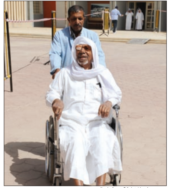
حرص على المشاركة من كبار السن