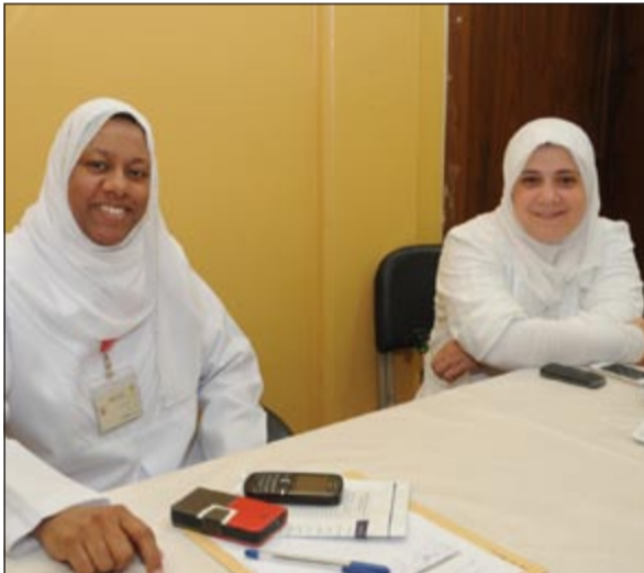
عضوتان من الهلال الأحمر

من جانبه، قال المرشح يعقوب الصانع ان خيار الناخبين الوطنيين والشرفاء دائما يميل لاختيار المرشحين الأكفاء الممثلين للوطن لا طوائفهم أو عرقهم أو قبيلتهم، معربا عن تفاؤله بان تصوي غير منخفضة. وقال المرشح جمال العمر ان المشاركة في هذه الانتخابات