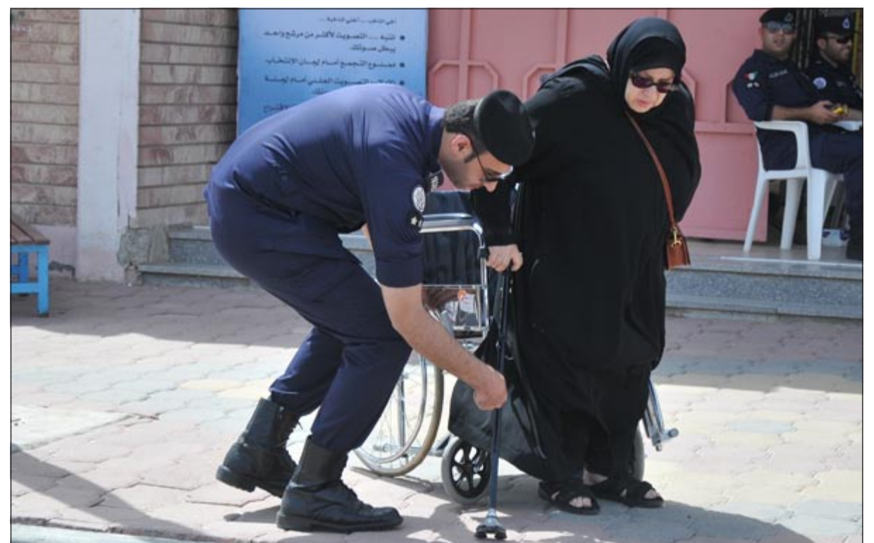
أحد رجال «الداخلية» يساعد إحدى كبيرات السن