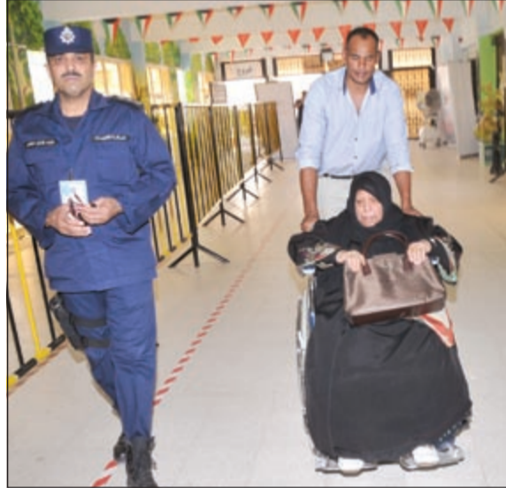
ناخبة كبيرة في السن حرصت على الإدلاء بصوتها