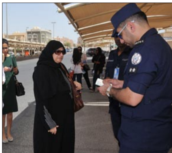
التأكد من الثبوتات