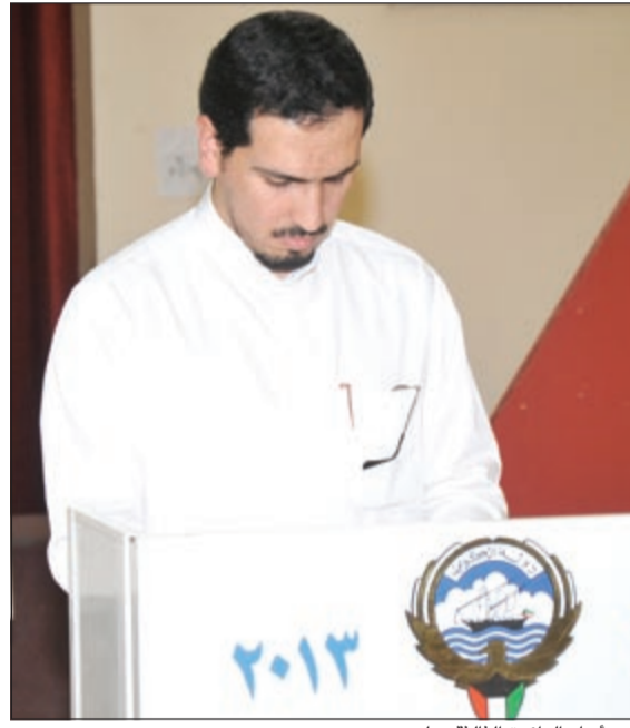
أحد أبناء الدائرة الثالثة يدلي بصوته