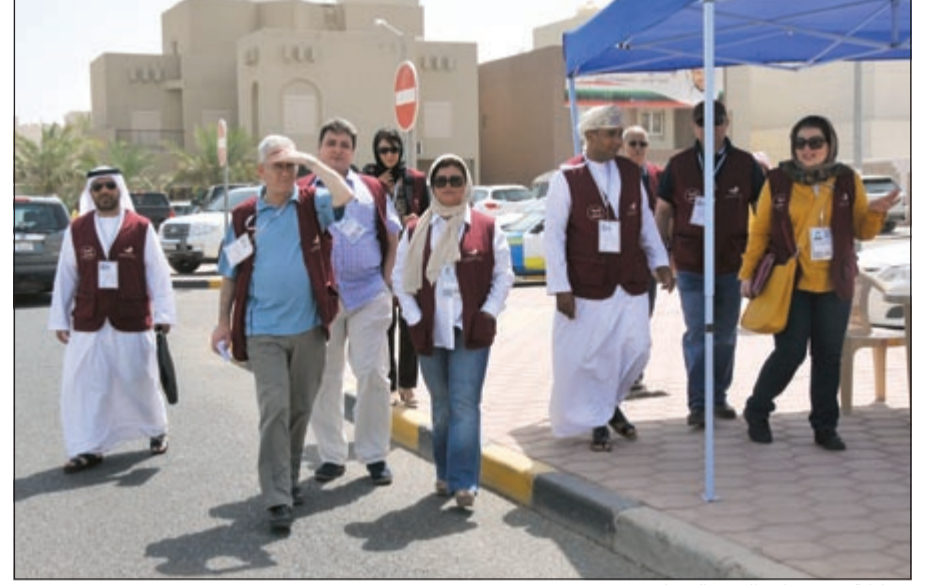
مشاركة رغم حرارة الجو والصيام