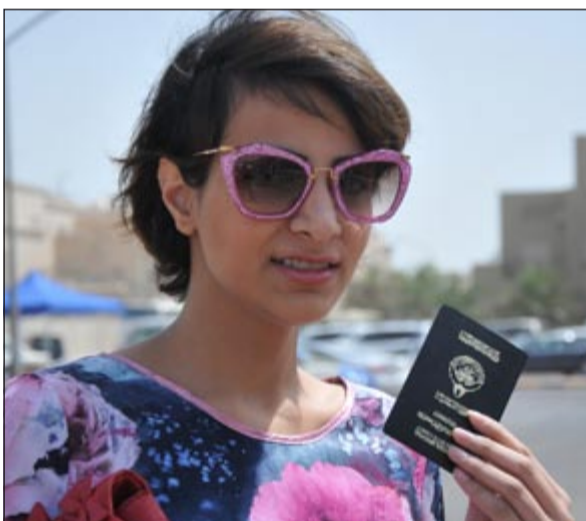
ناخبة ترفع جنسيتها