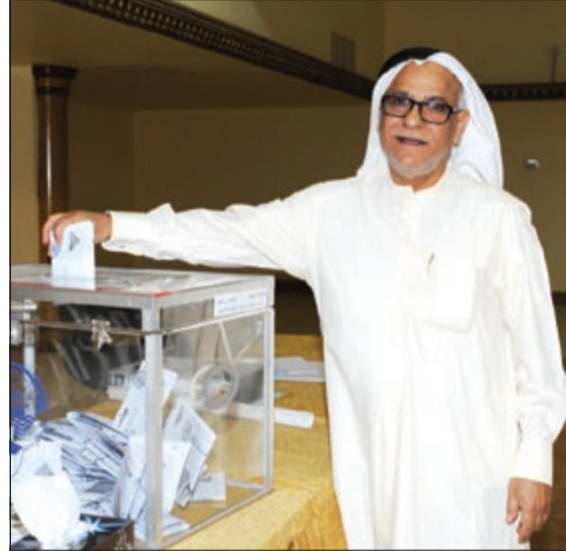
مشاركة في العرس الديمقراطي