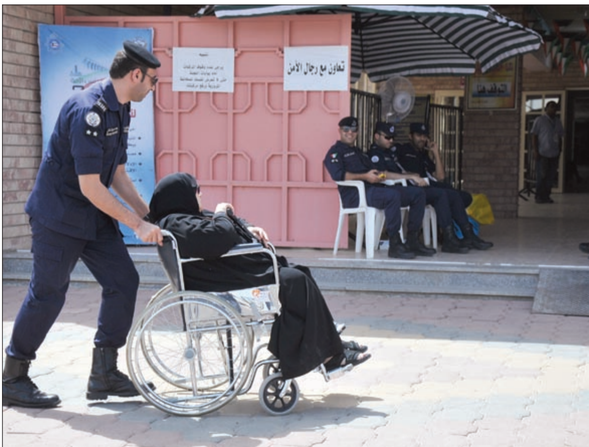
كفو.. كفو.. رجال الأمن خير معين