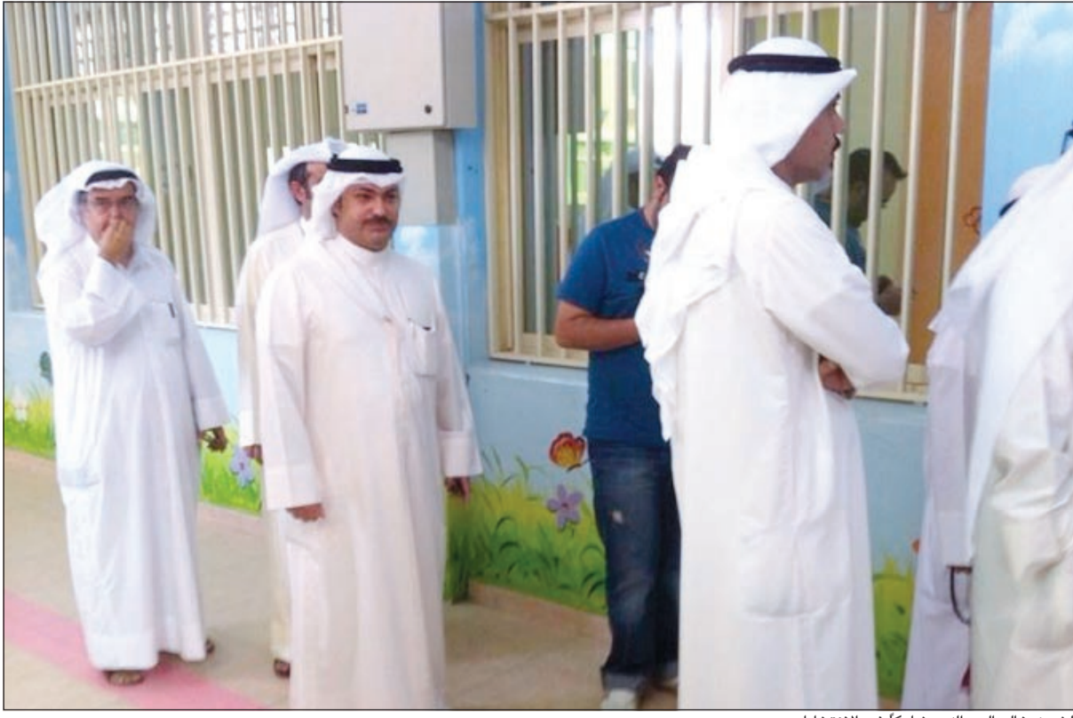
الشيخ خالد العبدالله مشاركاً في الانتخابات