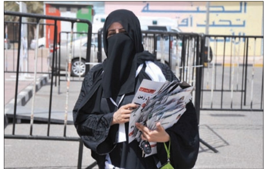
مندوبة أحد المرشحين تحمل بعض أشكال الدعاية الانتخابية