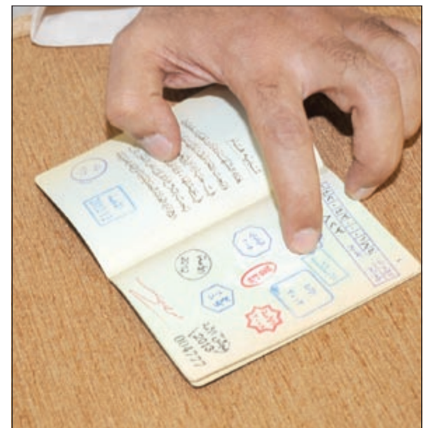
التأكد من ختم الجنسية