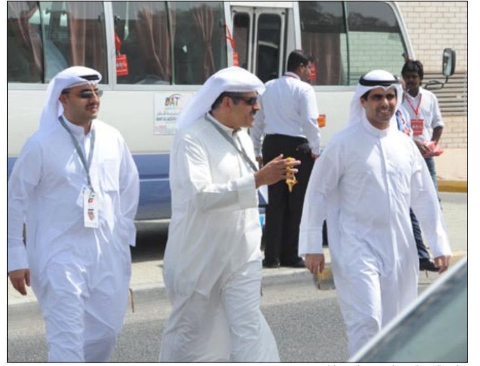
رياض العسائي يتابع سير الانتخابات