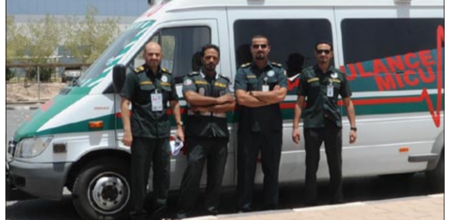
رجال الطوارئ الطبية ما قصروا

الخرافي: نريد مجلساً قادراً على الإنجاز وتحقيق طموحات أعربت د.فايزة الخرافي عن سعادتها بالمشاركة في عرس الكويت الديموقراطي، مشيدة بالناخبين والناخبات الذين تحملوا حرارة الجو ومشقة الصيام من أجل المشاركة، متوقعة أن تزيد أعداد الناخبين في فترة ما بعد الظهر. وتمنت الخرافي أن نعطي صوتنا للأصلح حتى تكون المحصلة مجلساً من النخبة قادرا على الإنجاز وتحقيق طموحات وأحلام الشعب الكويتي.