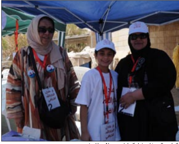
الكبار والصغار شاركوا في حملات المرشحين