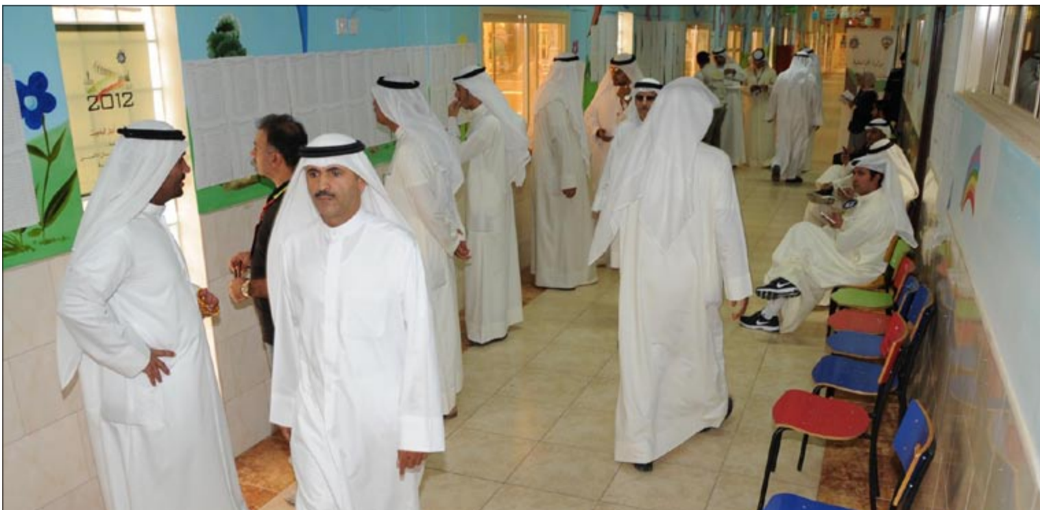
اقبال شبابي على التصويت