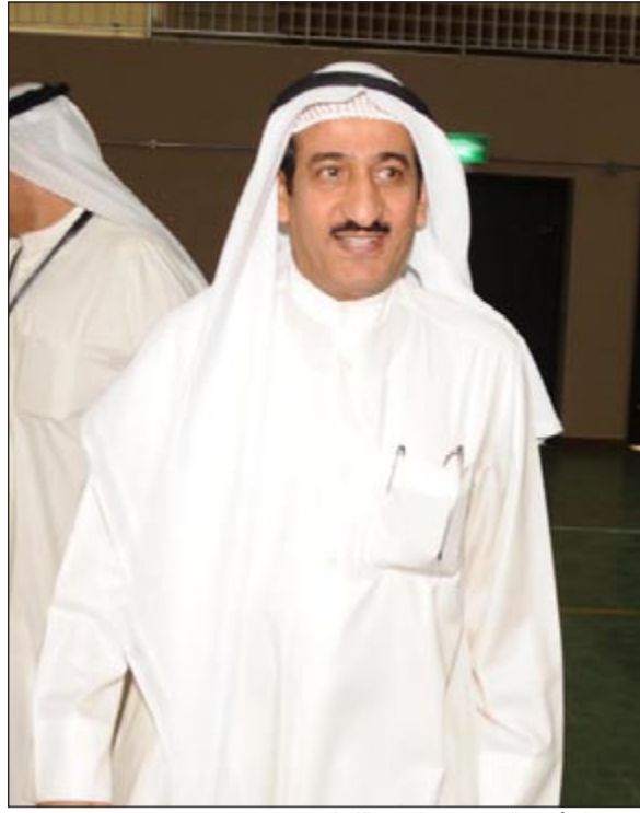
المستشار أحمد العجيل في احدى اللجان