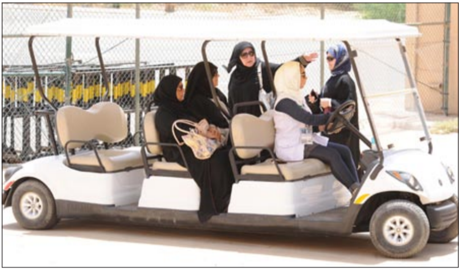
سيارات لمساعدة الناخبات