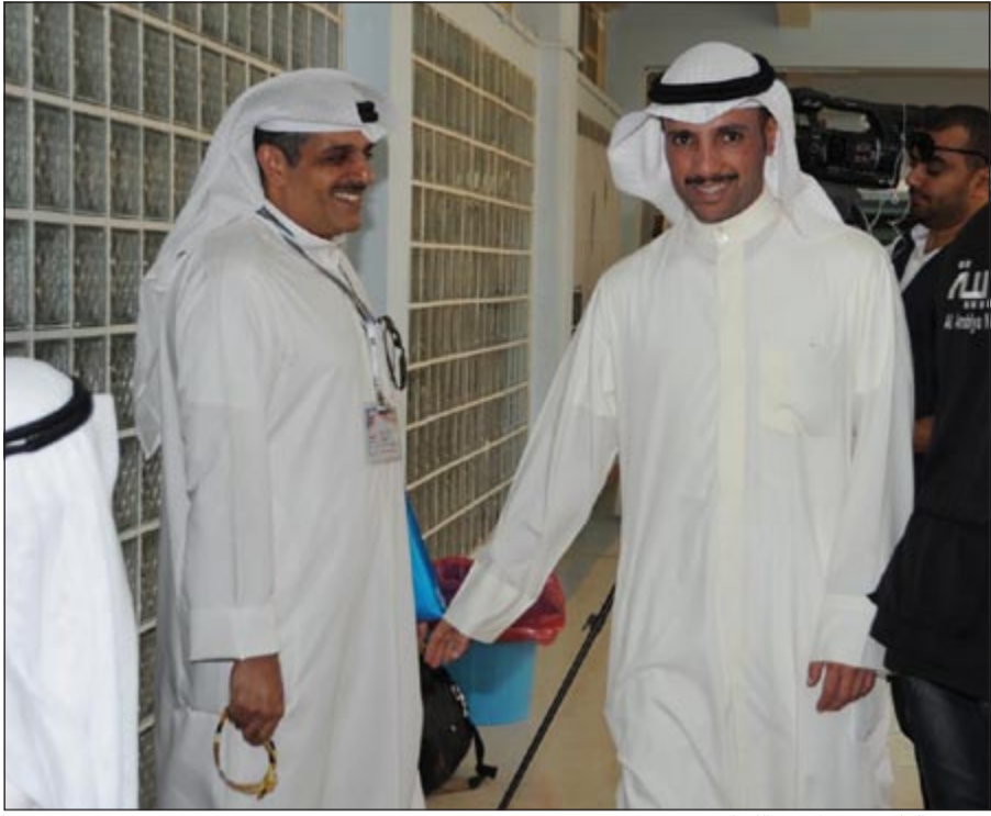
مرزوق الغانم يتفقد احدى اللجان