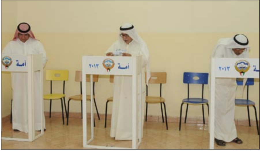
من أجلك يا كويت