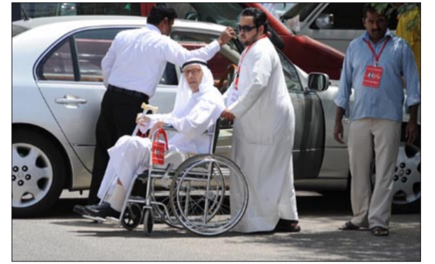
استقبال كبار السن في مواقف السيارات