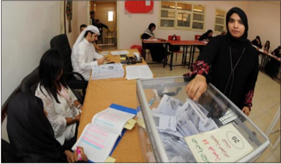
صوتي .. وعطيت