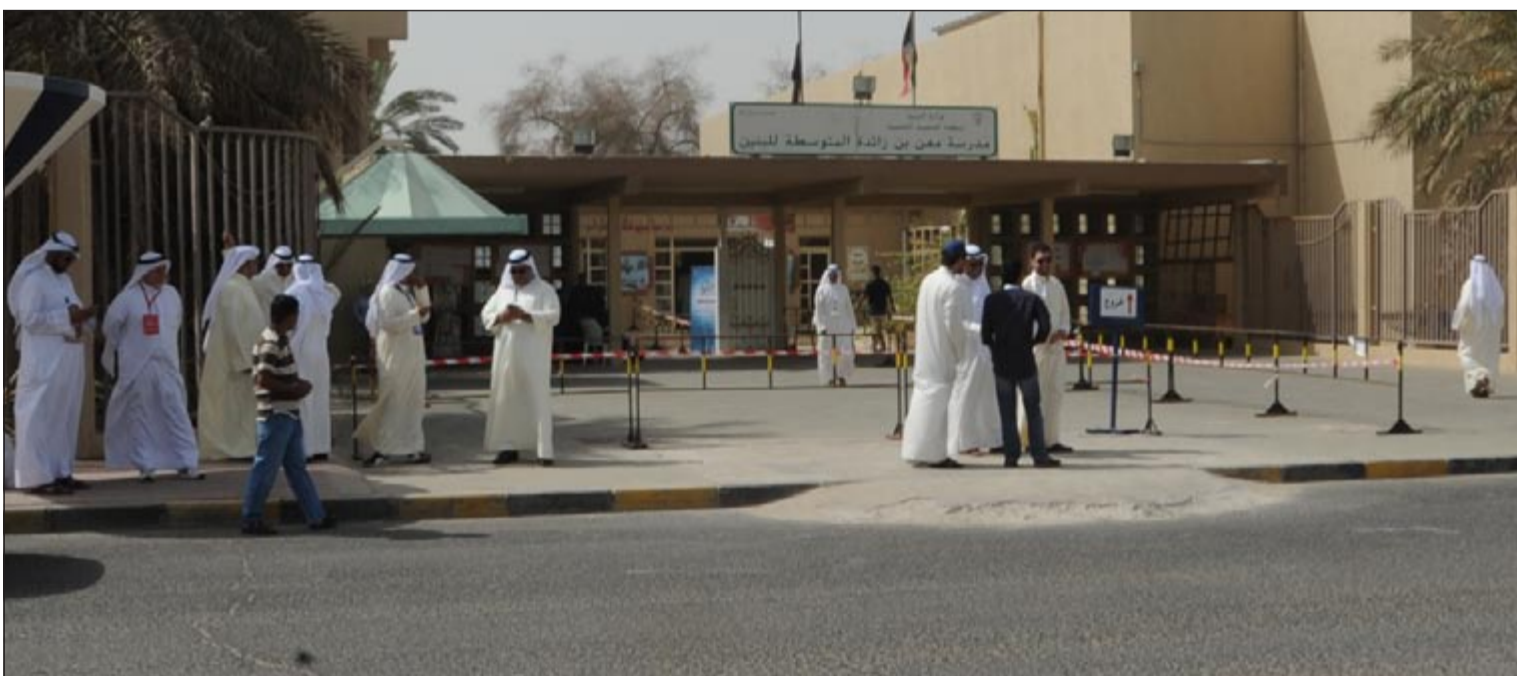
حركة هادئة في محيط أحد مقرات الاقتراع