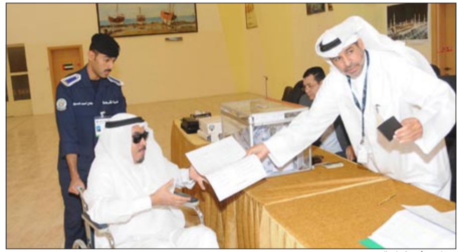
مساعدة أحد كبار السن