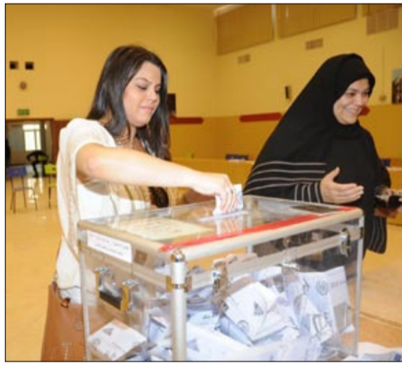
تفاوض بمستقبل الكويت مع المجلس الجديد