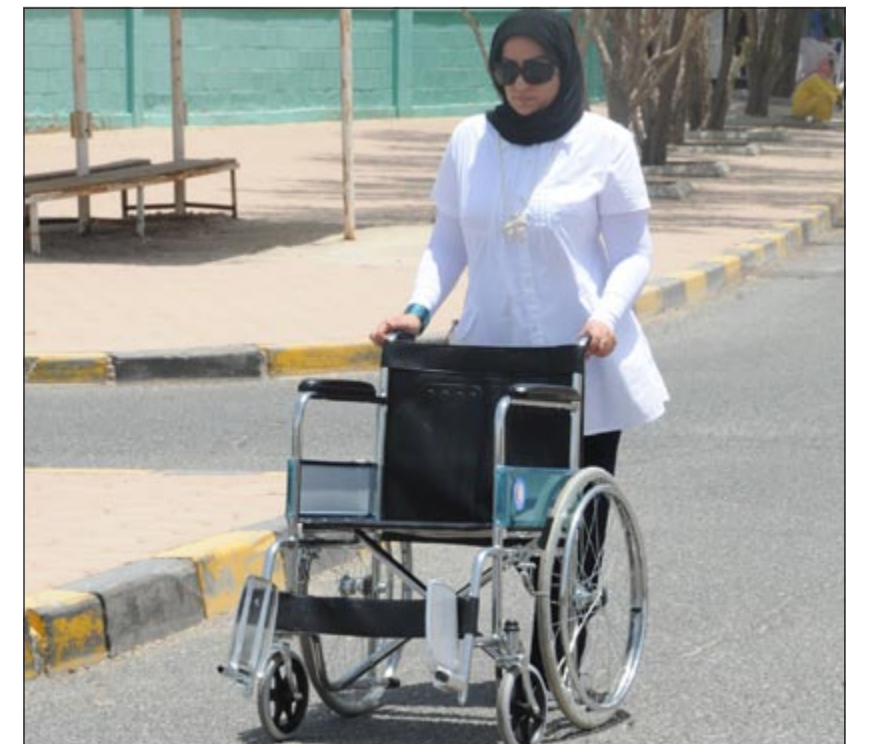
استعداد لمساعدة المسنات