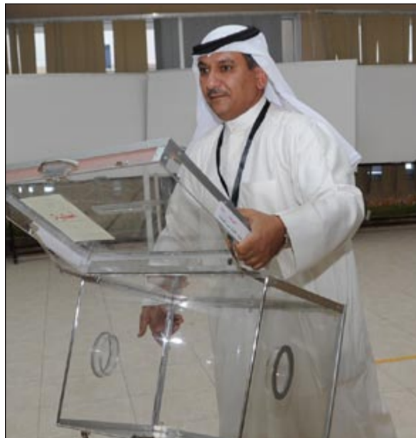
التأكد من سلامة الصندوق قبل التصويت