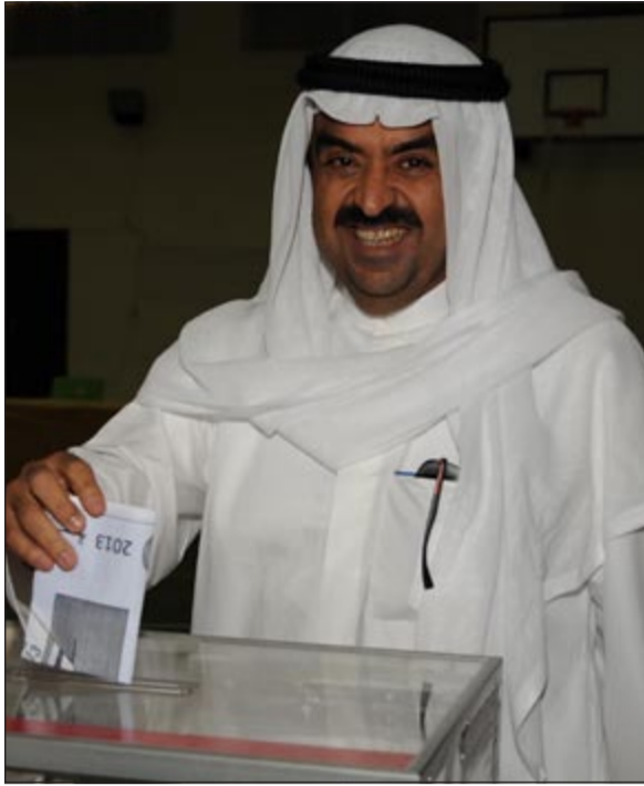
الشيخ خالد البدر يبلي بصوته