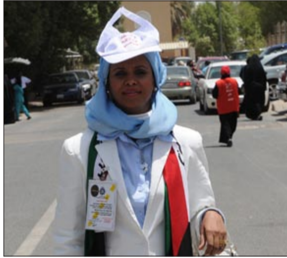
احتياطات ضد حرارة الشمس