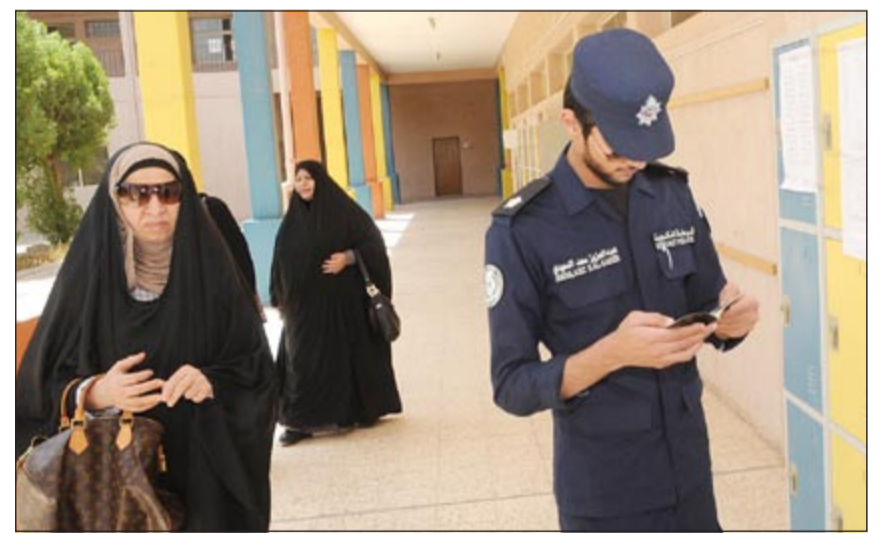
أحد رجال الأمن يساعد مواطنة في معرفة لجننتها