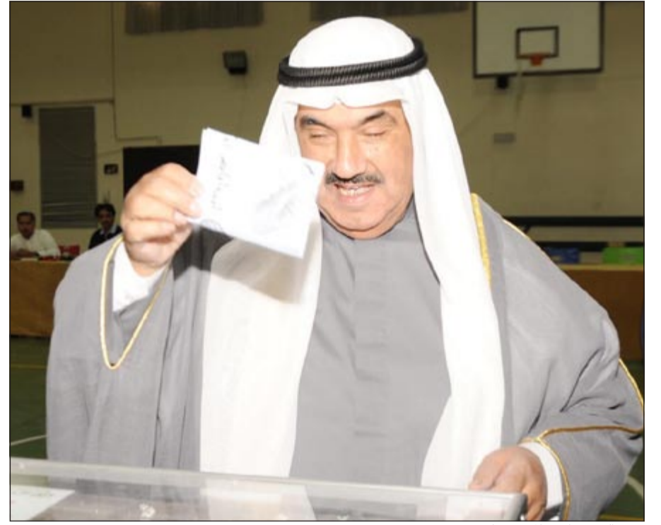
سمو الشيخ ناصر المحمد بنلي بصوته