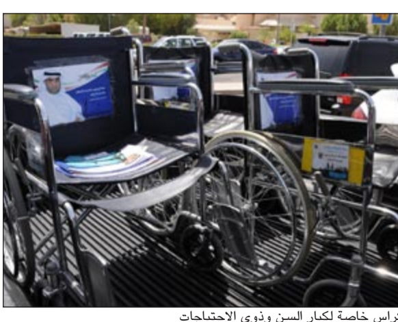
كراس خاصة لكبار السن وذوي الاحتياجات