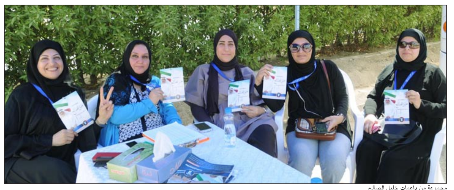
مجموعة من داعمات خليل الصالح