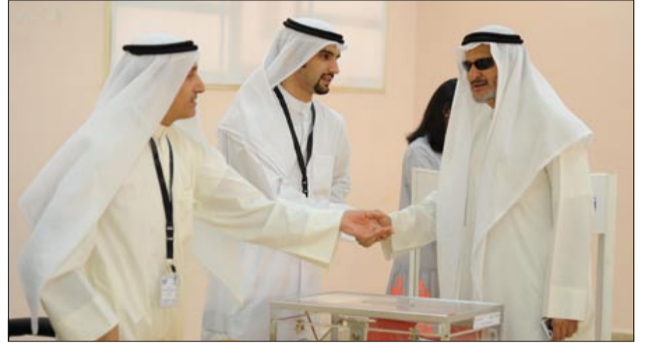
مبارك المطوع يتابع سير العملية الانتخابية