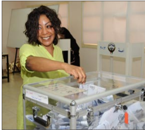
فرحة بالعرس الديمقراطي