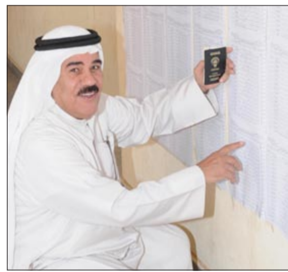
ناخب يبحث عن قيده