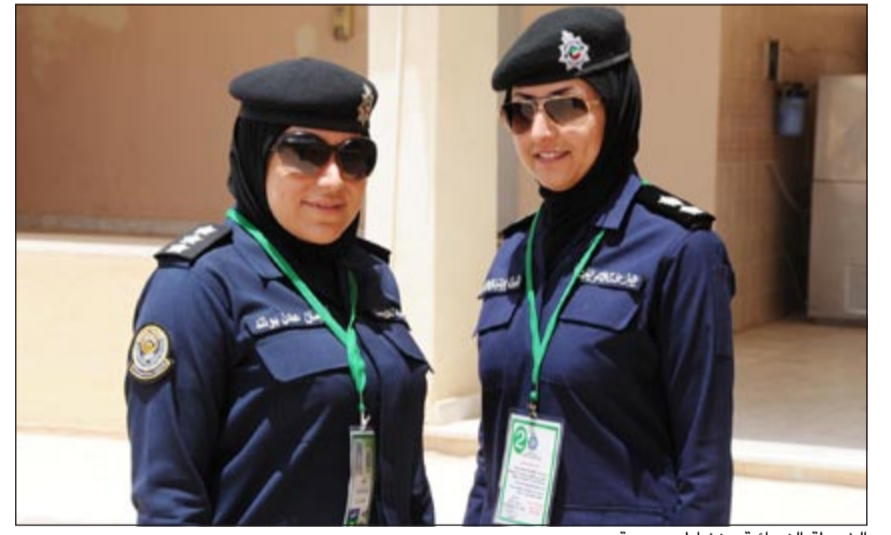
الشرطة النسائية.. نشاط وحيوية