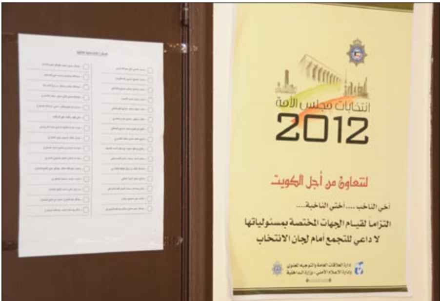
تعليمات من «الداخلية» للناخبين