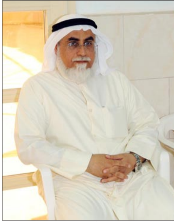
د.عبدالحسن الجارالله الخرافي في أحد مقرات الاقتراع