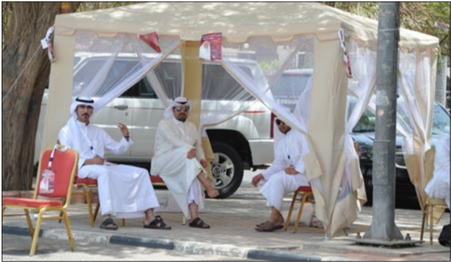
مظلة اللقاية من الحر