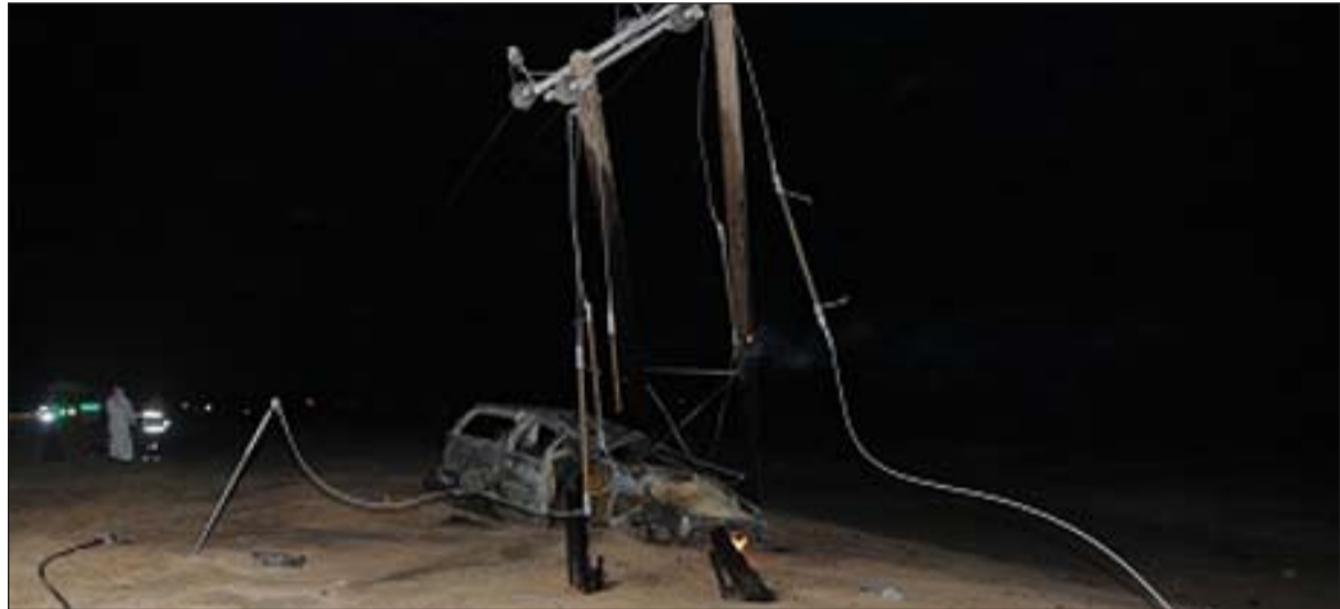
رجال الإطفاء فصلوا التيار الكهربائي عن المنطقة المحيطة

والاشخاص الذين لقوا حتفهم، مشيراً الى أن المتوفين 3 أشخاص ومواطنان ومواطنة وإماراتي وأسبوية، وأشار المصدر الى أن المصابين هم (ح.أ.)، (ع.أ.)، (م.أ.)، (ع.ع.) كويتيون والإماراتيون المصابون (ز.س.) و(ف.س.) و(ع.س.)، (ع.ع.) نكران وخادمتان.