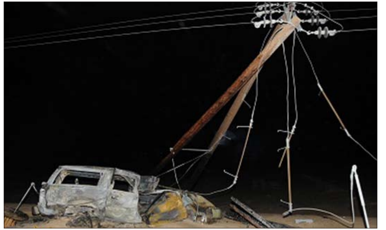
كبيبات الضغط العالي سقطت على المركبة بعد التصادم