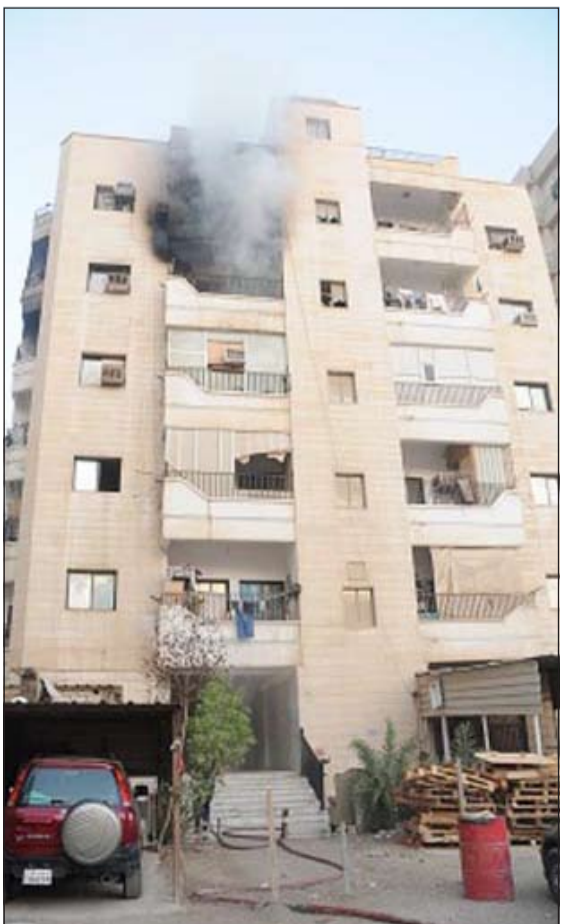
دخان كثيف انبعث من داخل الشقة ودفع «الإطفاء» إلى إخلاء البناية