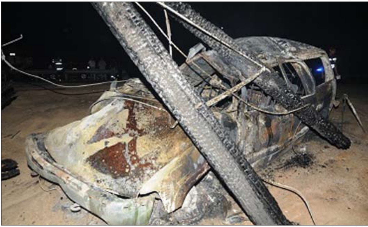
المركبة وقد تحولت إلى ركام بعد الحادث