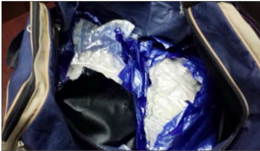
الهيروين المضبوط بحوزة الوافد الهندي

عبدالله قنص - محمد الجلاهمة - هاني الظفيري