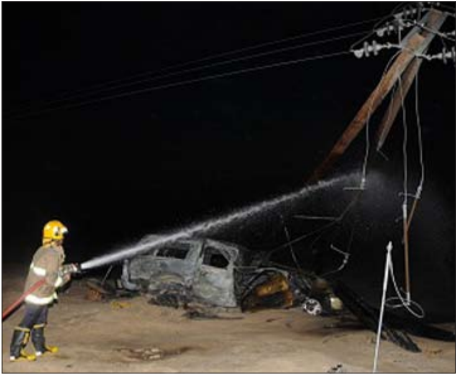
أحد رجال الإطفاء يتعامل مع الحادث في أعقاب التأكد من فصل التيار الكهربائي