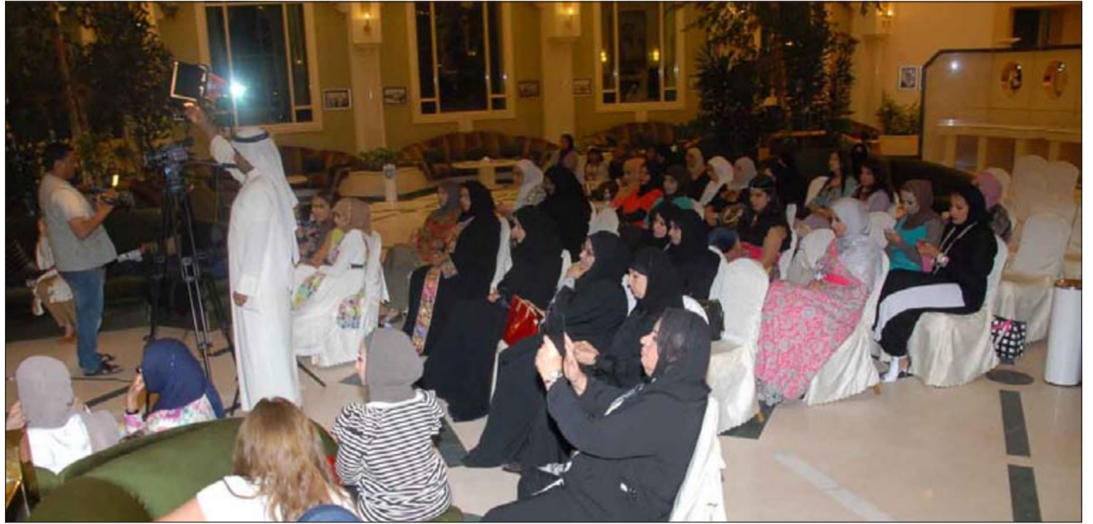
ناخبات الدائرة الثالثة أثناء الغيبة

قال خلال غيبة رمضانية نسائية إن الحديث عن المرأة والمطالبة بحقوقها ليس لدغدغة المشاعر