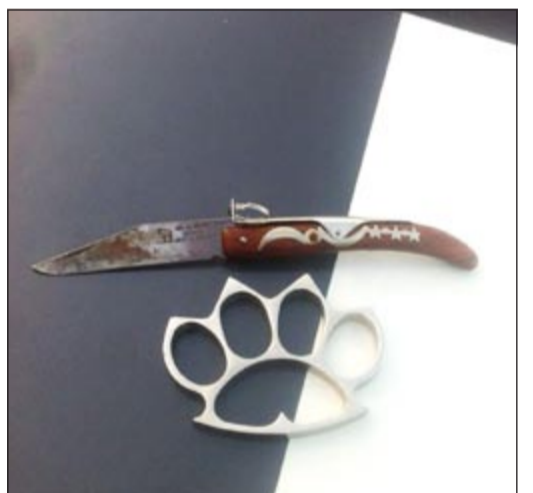
«الرنق» والسكين المخبوطين في حوزة الخليجي

أسفرت حملة جديدة شنّها رجال امن الاحمدي بتعليمات من مدير الامن اللواء عايض العتيبي وبإشراف ميداني من قبل رئيس الدوريات المقدم قالح الهذلي والرائد سلمان الألفي على الطريق الساحلي مقابل المنقف امس عن ضبط مطلوب لادارة التنفيذ المدني لـ 19 ألف دينار الى جانب ضبط متغيب وتحرير 55 مخالفة مرورية و3 واديين مخالفين لقانون الإقامة، وقال المصدر الامني ان حملة امن الاحمدي والتي امتدت على مدار 3 ساعات اسفرت عن ضبط شاب خليجي تمت احالته الى الادارة العامة للمباحث الجنائية بعد ان ضبط بحوزته رنق وسكين، وأشار المصدر الى ان الخليجي سيحقق معه في اسباب حيازته لهذه الادوات المميّنة وعلاقته بجرائم سرقة بالاكراه.