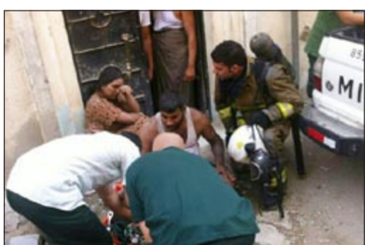
رجال الطوارئ الطبية يقدمون الاسعافات الأولية لاجد المصابين