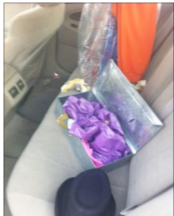
حجوب واودات تعاطي ضبطت في مركبة الهاربين

انقضت العناية الإلهية ملازمين من موت محقق على يد شخص كان يقود سيارته بسرعة جنونية أثناء عمل الملازمين نقطة تفتيش في منطقة عبدالله المبارك وتم اللحاق بالشخص الذي كان ان يدهس رجال الشرطة متجاوزاً نقطة التفتيش حتى اصطدم بالرصيف وأطلق صاعقه للريش، وقال مصدر امني ان رجال أمن مخفر عبدالله المبارك كانا يقيمان نقطة