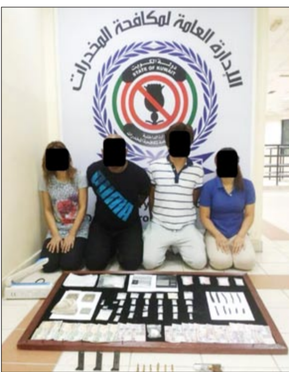
التهمون وامامهم المخبوطات

نقلت جثة شاب الى الطب الشرعي للوقوف على اسباب وفاته، كما قام رجال المباحث الجنائية بإرسال تصوير كامل لفترة تواجد الشاب داخل النظارة للتأكيد على