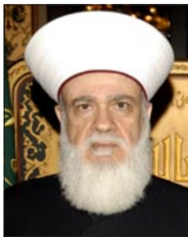
د. محمد رشيد قباني

رئاسة الحكومة بالتجديد لسوسان استناداً الى قرار المجلس الإداري لأوقاف صيدا بتجديد تعيينه بالتعاقد. وقدرت دار الفتوى ببيان على رئاسة الحكومة بإقرار التجديد للمشيخ سوسان بالتدخل السافر في شؤون وصلاحيات مفتي الجمهورية وطالبتها بالاهتمام بالقضايا التي تدخل في صلب اختصاصها وترك شؤون الإفتاء والأوقاف الإسلامية الى مفتي الجمهورية صاحب القرار استناداً لأحكام المرسوم الاشراعي رقم 55/18 وعدم منازعته في صلاحياته.