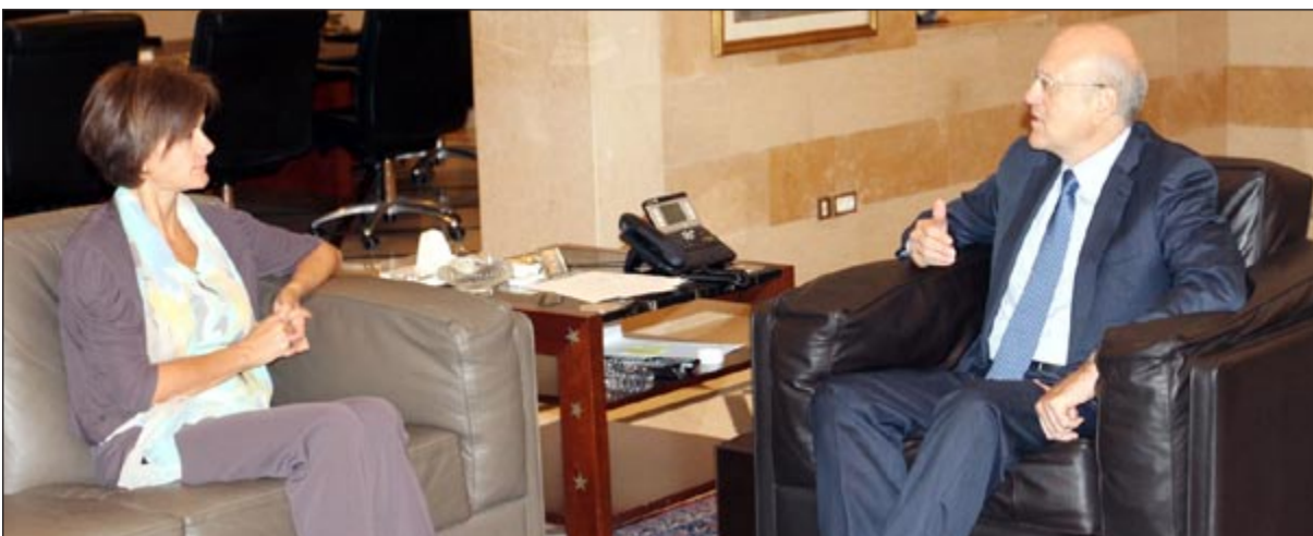
رئيس حكومة تصريف الاعمال نجيب ميقاتي مستقبلاً سفيرة الاتحاد الأوروبي انجيلينا اينهورست