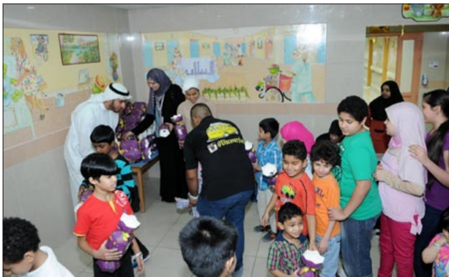
متطوعو البنك يزورون القرقيعان على الأطفال

العادات الاجتماعية الكويتية الأصيلة التي ارتبطت على مر السنوات بالشهر الفضيل ويتضمن البرنامج الاحتفال به مع ذوي الاحتياجات الخاصة سعياً من البنك لتشجيعهم ودعمهم في المجتمع بصورة أكبر.