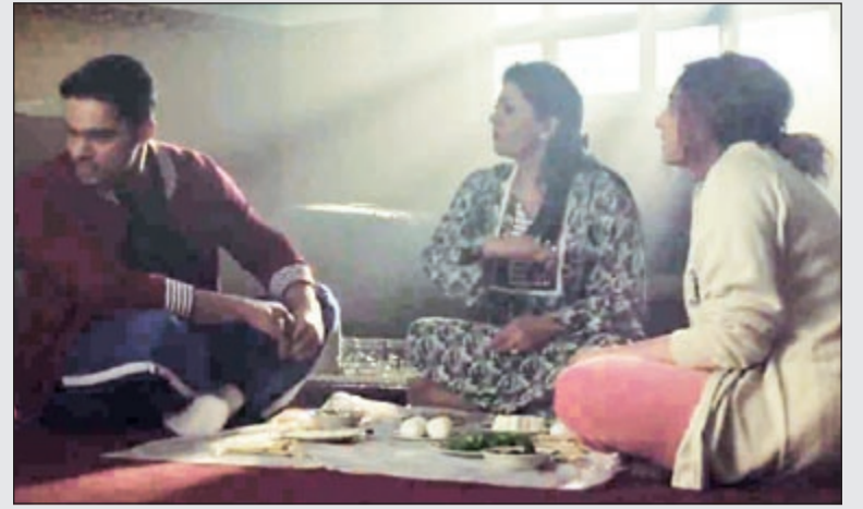
فاطمة الحوسني في «بركان ناعم»

في مسلسل «بركان ناعم» تظهر الممثلة الاماراتية فاطمة الحوسني في أكثر من حلقة وهي تباليغ في البيجي مع انه المشاهدين تعرفوا على ظروفها الاسرية مع أول مشهد من هذا المسلسل ومع ذلك مستمرة في هذي المبالغة.. الله يكون في عون المشاهدين!