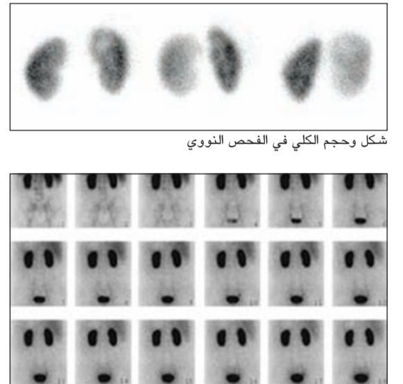
متابعة مسار المادة المشعة من لحظة امتصاصها بالكليتين حتى إفرازها بالثانة

الاشعاع الكلى في الفحص النووي شكل وحجم الكلى في الفحص النووي