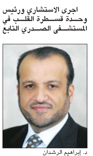
د. ابراهيم الرشدان

لوزارة الصحة د. ابراهيم الرشدان عملية قسطرة لمرضى وهو جالس على كرسي تعد الاولى من نوعها بعد عدم امكانية اجرائها على سرير العمليات الطبي المعتاد وعدم امكانية استخدام اجهزة الاشعة المقطعية والمغناطيسية بسبب السمعة المفرطة التي يعانيها المريض. وقال الرشدان لـ «كونا» أمس الأول إنه بعد تعذر إجراء عملية القسطرة لهذا المريض في وضعها المعتاد تم تغيير غرفة العمليات للتمكن من إجرائها وهو في وضعية الجلوس.