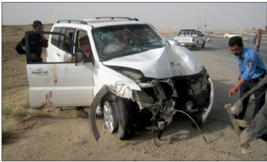
رجل أمن عراقي يتفقد سيارة محطمة اثر تفجير في كركوك امس

الى ذلك، قتل 7 عراقيين بينهم 4 شرطيين، فيما أصيب 6 أشخاص بجروح بحدوث أمنية منفصلة في محافظات كركوك وصلاح الدين ونيوى وبغداد امس. ففي كركوك قتل اثنان من حراس مبنى مجلس ناحية الرشاد التابعة للمحافظة بانفجار عبوات ناسفة بمحيط المبنى.