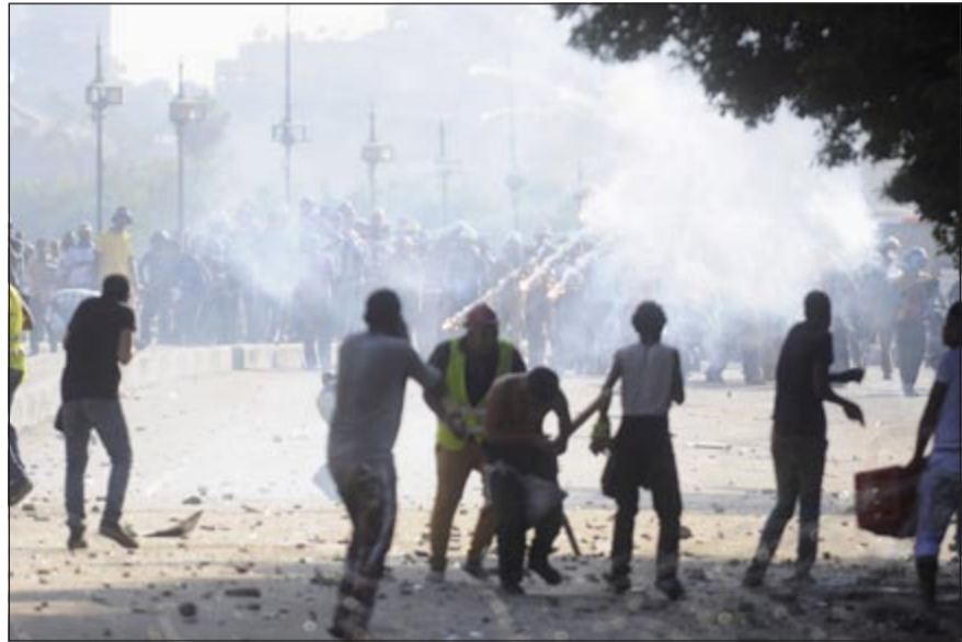
عناصر مؤيدة للرئيس المصري المعزول مرسي يهاجمون معارضيه بالقرب من ميدان التحرير أمس الأول

«توسع الجميع وتخطى الانقسام وتسعى للمصالحة ومواصلة المسيرة لتحقيق بناء الوطن لا حقد فيها ولا كراهية»، تنعم بالحرية والكرامة والعدالة والاستقلال والوطنية.. وقال منصور في كلمة وجهها إلى الأمة عبر التلفزيون الرسمي الليلية قبل الماضية بمناسبة ذكرى ثورة 23 يوليو أنه كان الوقت لبنني وطنًا متصالحًا مع الذات وتقيم الصلح في عقولنا ونفوسنا حتى نجد في حياتنا.