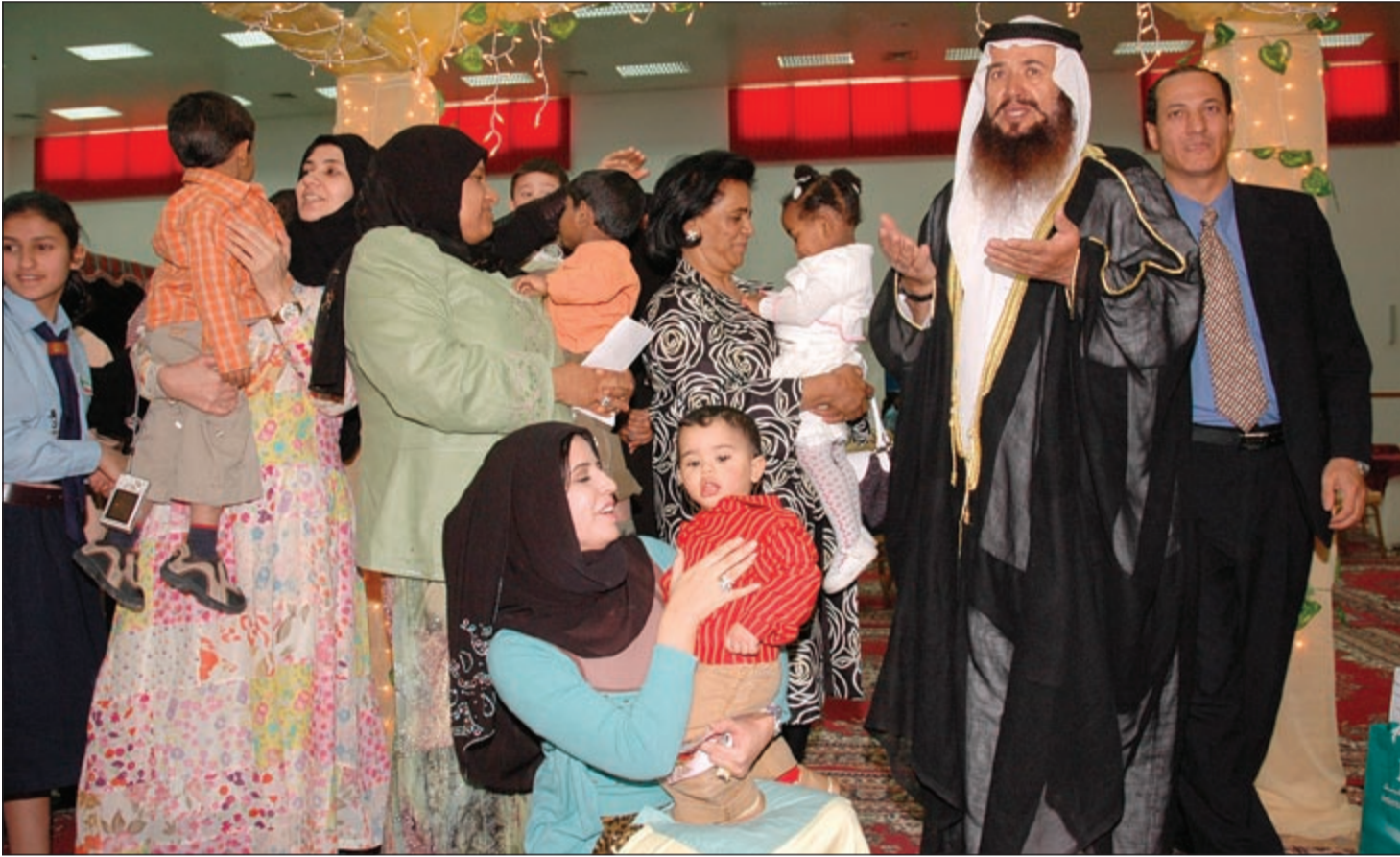
في أحد نشاطات العمل الخيري