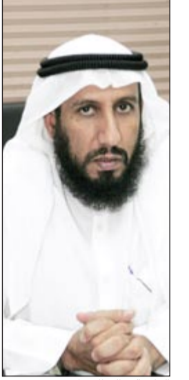
الداعية خالد الخراز