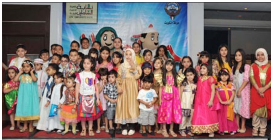
بعض الأطفال المشاركين في الغبقة

وهو بمثابة بنك المعلومات الرسمي والوحيد البيئي في الدولة. وأشار الى ان هذا المركز يعني بضمن تغطية جميع قطاعات العمل البيئي بالبيانات البيئية كونه مركزاً رئيسياً للبيانات البيئية بما يمكن الهيئة من اتخاذ القرارات البيئية ودعم التنفيذ والتشريعية وغيرها من اعضاء المجتمع المدني والقطاع الخاص في تداول البيانات البيئية والصحية والمعتمدة وتسهم