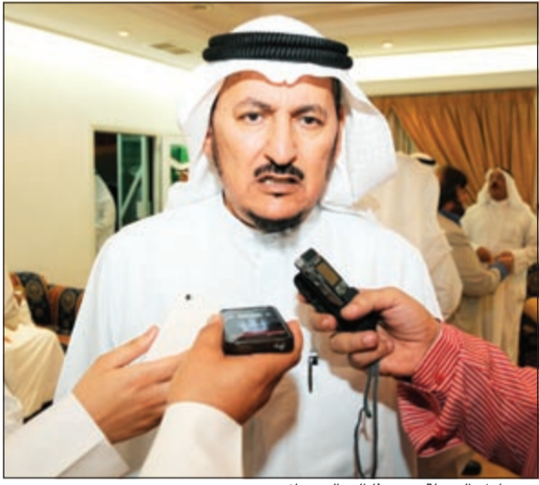
م. مبارك الدولية يتحدث إلى الصحفيين

الخرافي: أدعو الشعب الكويتي للمشاركة بفاعلية في الانتخابات من جهته أكد رئيس مجلس الأمة السابق جاسم الخرافي أن الشعب الكويتي اعتاد على مثل هذه التجمعات المباركة في شهر رمضان المبارك، والتي تتجاوز الخلافات السياسية وتطغى بالمحبة والألفة في النهاية. وعن موقفه من الانتخابات القادمة قال الخرافي إنه من المؤيدين للمشاركة في الانتخابات، داعياً الشعب الكويتي إلى المشاركة بفاعلية معرباً عن أمه أن تكون صفحة جديدة للجميع، معرباً عن تفاؤله بأن تكون خطوة إيجابية نحو المستقبل.