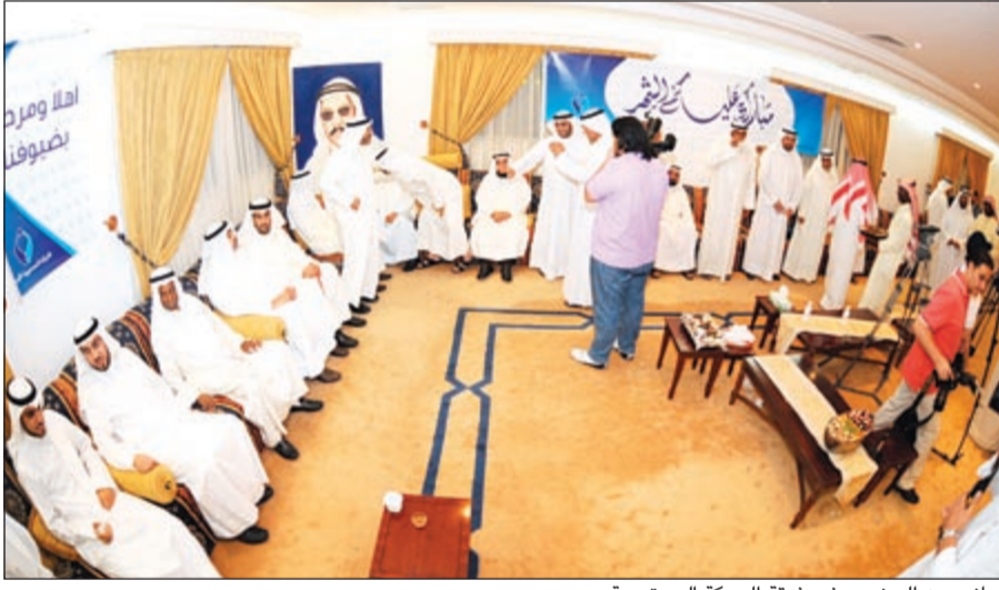
جانب من الحضور في غبة الحركة الدستورية

أعرب أمين عام الحركة الدستورية الإسلامية النائب السابق د. ناصر الصانع عن سعادته الغامرة بالحضور الحاشد والمتنوع الذي يعبر عن مدى تماسك الشعب الكويتي بمختلف شرائحه وانتماءاته حتى وإن اختلفت المواقف والرؤى السياسية، موضحاً أن الحضور يمثل كل ألوان الطيف السياسي الكويتي في هذه المناسبة السنوية التي تعكس الأجواء الروحانية التي تعيشها الكويت في شهر رمضان المبارك. وأشار الصانع خلال غبة إقامته الحركة الدستورية الإسلامية إلى أن الأوضاع الاجتماعية تغلبت على الأوضاع السياسية وأكبر دليل هو الحشد من الزائرين والذي فاق الحضور في الأعوام السابقة.