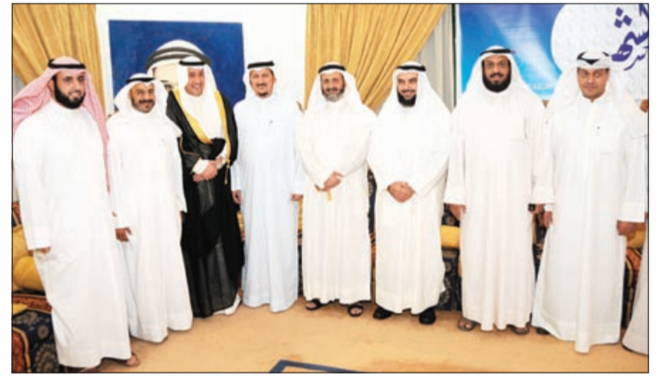
الشيخ فيصل الحمود يقدم التهاني إلى م. مبارك الدولية وقيادات الحركة الدستورية (هاني الشمري)

الخرافي: أدعو الشعب الكويتي للمشاركة بفاعلية في الانتخابات من جهته أكد رئيس مجلس الأمة السابق جاسم الخرافي أن الشعب الكويتي اعتاد على مثل هذه التجمعات المباركة في شهر رمضان المبارك، والتي تتجاوز الخلافات السياسية وتطغى بالمحبة والألفة في النهاية. وعن موقفه من الانتخابات القادمة قال الخرافي إنه من المؤيدين للمشاركة في الانتخابات، داعياً الشعب الكويتي إلى المشاركة بفاعلية معرباً عن أمه أن تكون صفحة جديدة للجميع، معرباً عن تفاؤله بأن تكون خطوة إيجابية نحو المستقبل.