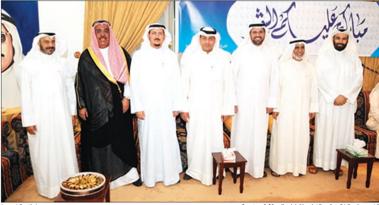
الشيخ جابر الخالد يقدم التهاني لقيادات الحركة الدستورية (هاني الشمري)