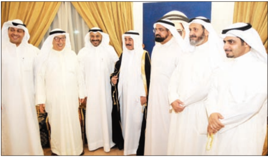
سلطان بن حثلين مهنتا