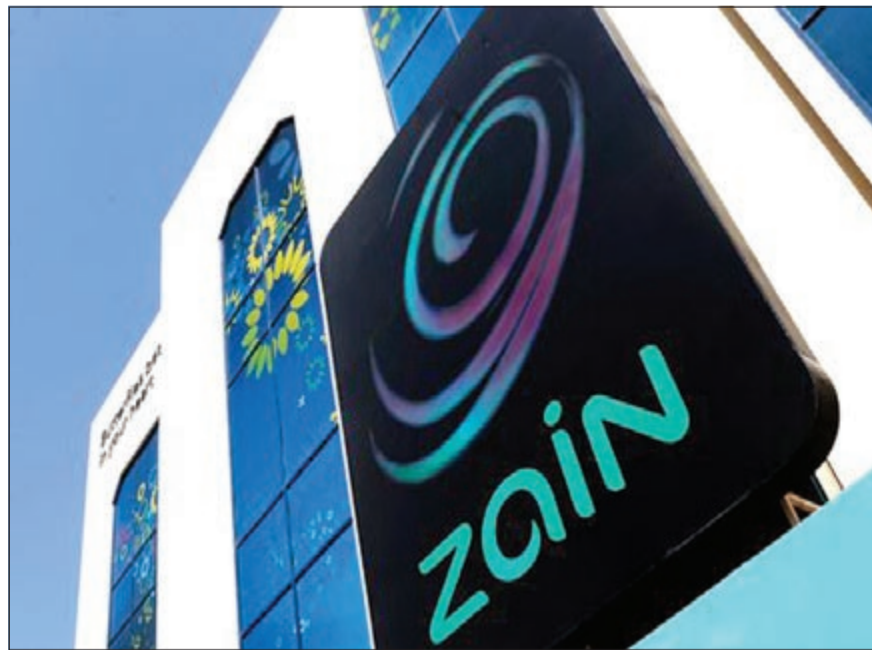
استثمارات «زين» في السودان للحفاظ على قيمة الأرباح من الانخفاض نتيجة تقلبات أسعار الصرف مقابل الدولار

الأول من العام. يذكر أن صافي ربح «زين» السودان قد هبط في الربع الأول من العام بنسبة 26٪ إلى 38 مليون دولار، وتراجعت الإيرادات بـ 41٪ إلى 154 مليون دولار، وذلك نتيجة هبوط قيمة الجنيه السوداني. جدير بالذكر أن الجنيه السوداني قد فقد أكثر من نصف قيمته منذ انفصال جنوب السودان في يوليو 2011، كما هبط الجنيه مقترفاً من مستوى قياسي منخفض أمام الدولار بعدما هدفت الخرطوم بوقف تدفقات النفط من جنوب السودان.