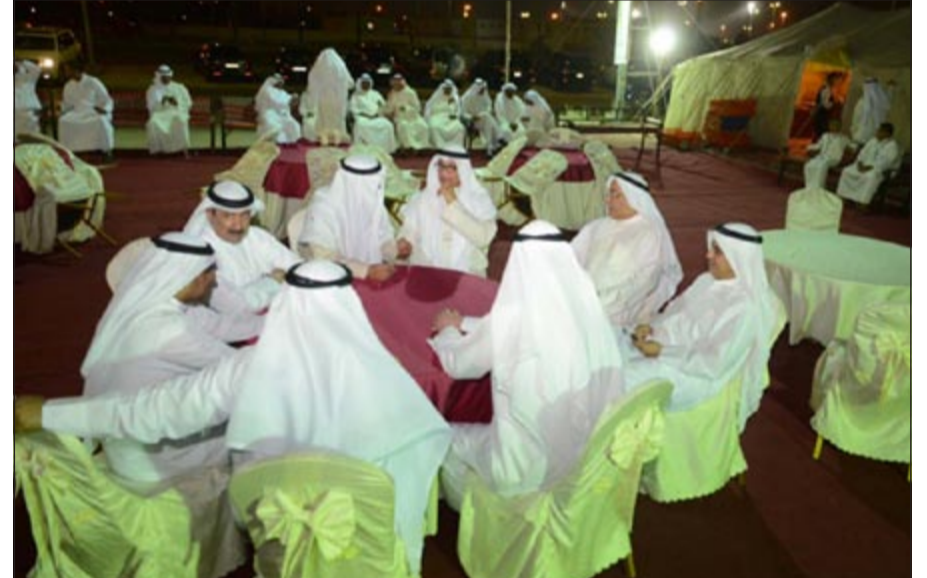
مجموعة من أبناء الدائرة