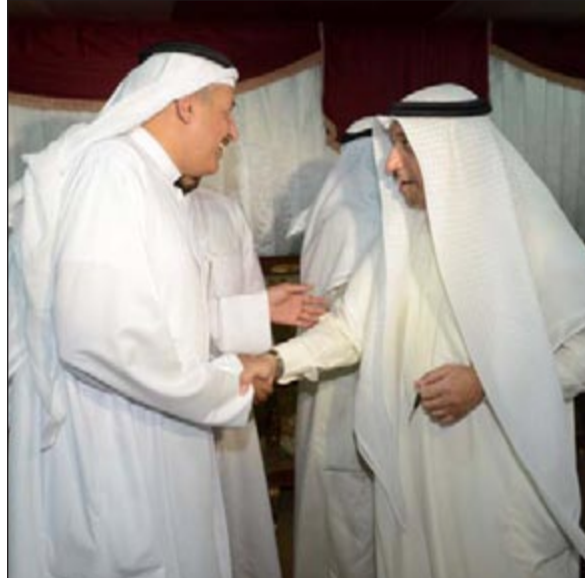
السريع مستقبلا أحد الناخبين