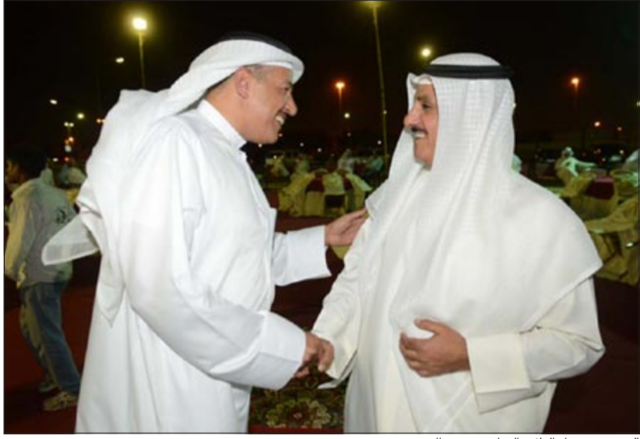
السريع مرحبا بالنائب السابق حسين الحريري