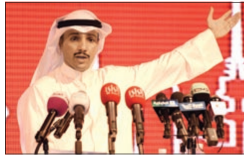
النائب السابق ومرشح الدائرة الثانية مرزوق الغانم (هاني الشمري)

مجبرة على تقديم خطة واقعية قابلة للتنفيذ.. ومستمر في خط التوازن والاعتدال والالتزام بالمكتسبات الدستورية 11