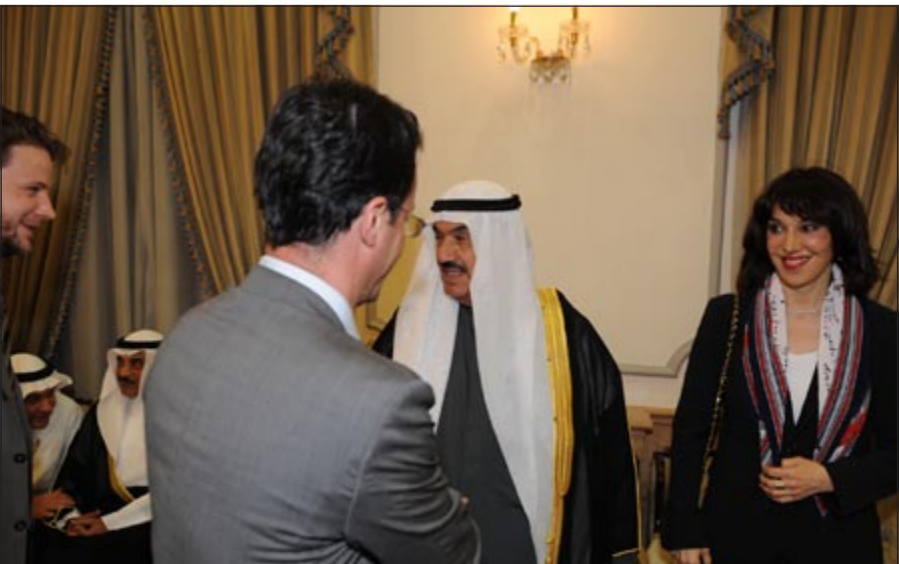
سمو الشيخ ناصر المحمد يتلقى التهاني وتبدو السفيرة الفرنسية ندى ياني