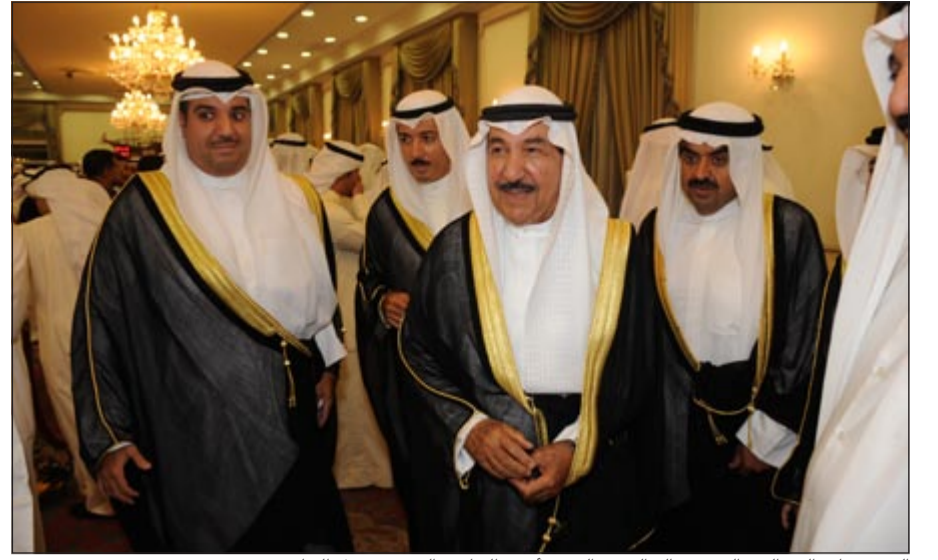
الشيخ جابر العبدالله والشيخ خالد البدر والشيخ أحمد الجابر والشيخ مشعل الجابر