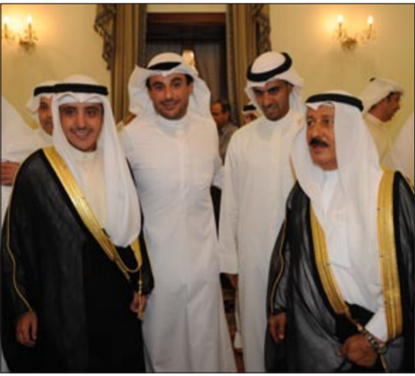
جواد بوخمسين مع مهنتي سمو الشيخ ناصر المحمد بالشهر الفضيل