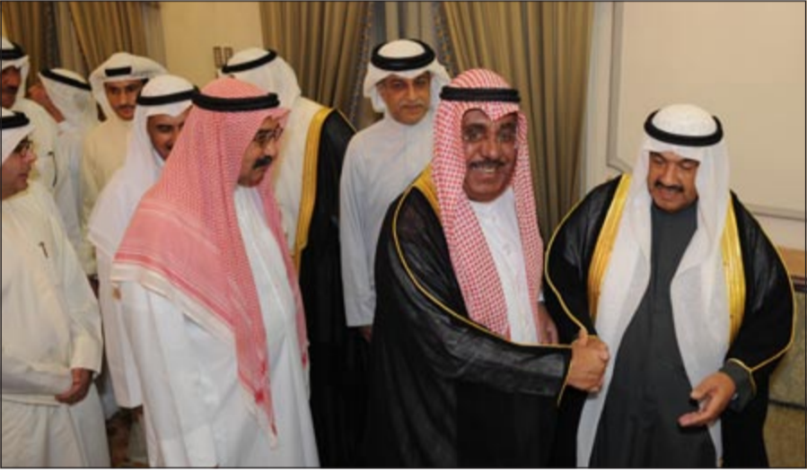
الشيخ جابر الخالد مهنتا