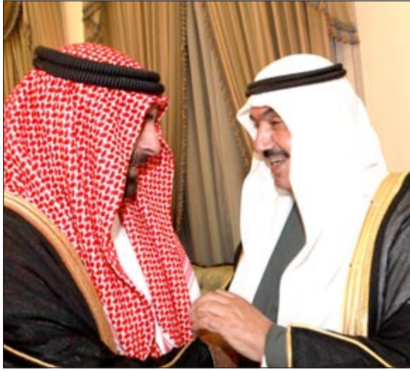
الشيخ أحمد الصباح يبارك لسمو الشيخ ناصر المحمد