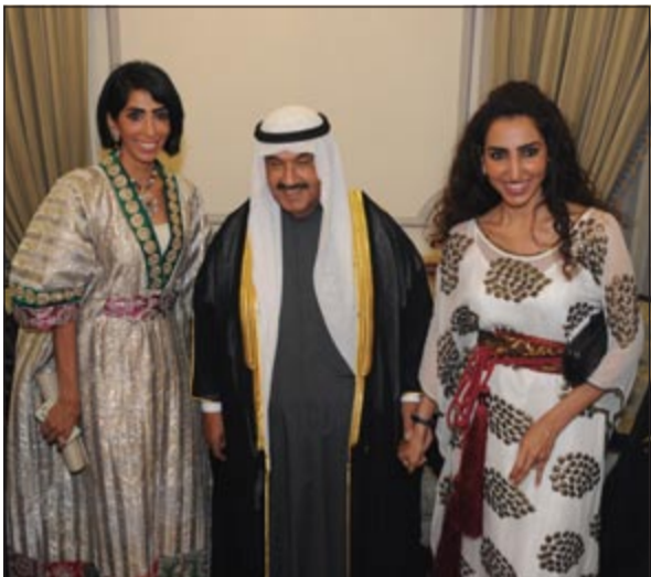
بسم ولولة الأيوب تباركان لسمو الشيخ ناصر المحمد