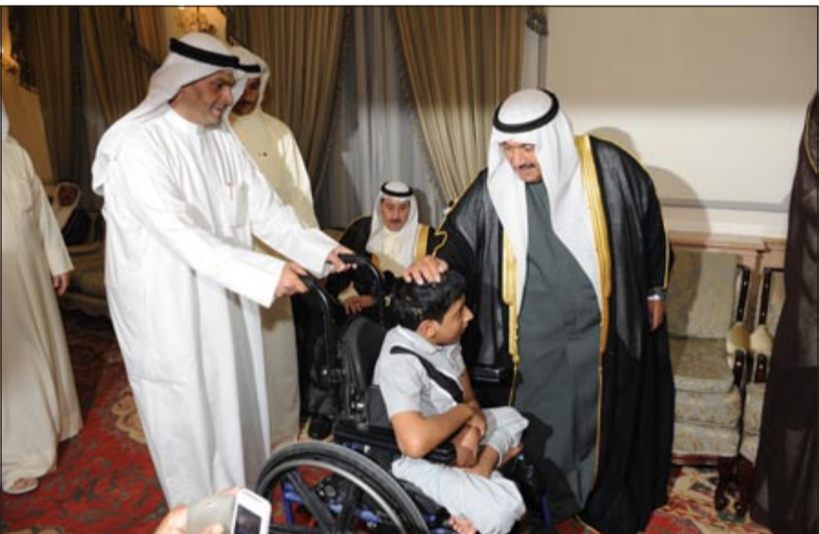
لمسة أبوية من سمو الشيخ ناصر المحمد لأحد المهنيين

من جانبه، قالت وزيرة الشؤون الاجتماعية والعمل ذكري الرشيدى إن الوزارة تراقب التبرعات في شهر