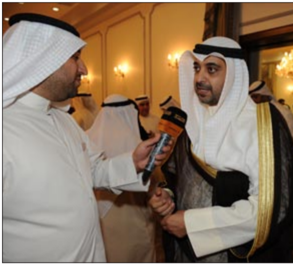
الشيخ محمد العبدالله متحدثاً للإعلاميين