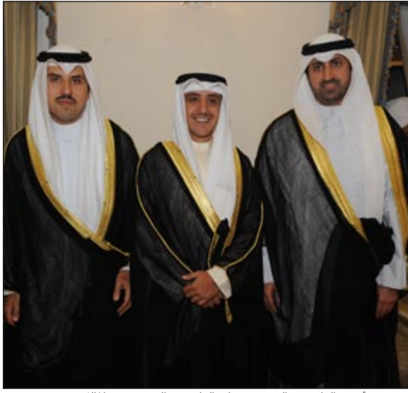
الشيخ د. أحمد الناصر والشيخ صباح الناصر والشيخ نمر المالك