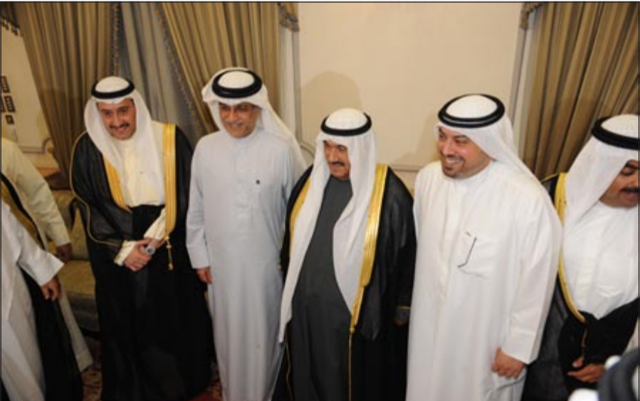
الشيخ طلال الفهد والشيخ فيصل الملك مع سمو الشيخ ناصر المحمد

الكويت عند سمو الشيخ ناصر المحمد، أهل الطبيب والكرم، شيوخ ووزراء ومسؤولون وديبلوماسيون، مواطنون وواقدون، آلاف من المهنيين توافدوا مساء امس الأول لتهنئة سموه بشهر رمضان الكريم، حيث أضيء قصر الشيوخ بأضواء محبة أهل الكويت وتواهم آل الصباح مع سموه وأسرة فخر كل مواطن ومقيم على هذه الأرض الطيبة. أحاديث محبة ومودة عن حب أهل الكويت لسمو الشيخ ناصر المحمد والتواصل الرائع الذي تتميز به الكويت بين أسرة آل الصباح الكرام مع الشعب الكويتي ككل، وحظت الانتخابات المقبلة على الأبواب ورسائل للتأخين وأيضا الأوضاع الإقليمية وخاصة مصر وسورية والعلاقات مع العراق وإيران بمساحة من الاهتمام وكانت حاضرة في الحديث في ظل دور الكويت الإقليمية المهم في تلك الملفات. في البداية، قال رئيس مجلس الأمة السابق جاسم الخرافي «رمضان كريم وكل عام وأهل الكويت وجميع