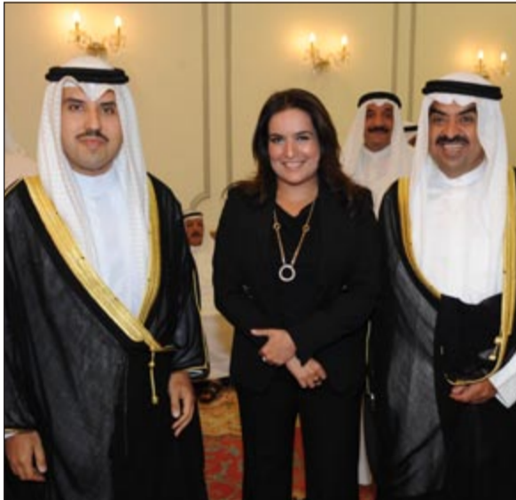
الشيخ خالد البدر وم.اشواق المصنف والشيخ صباح الناصر