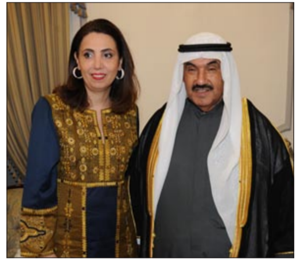
درولا دشقي تبارك لسمو الشيخ ناصر المحمد

بين الشعب الكويتي وقيادته، متمنياً أن يستمر مثل هذا التواصل على الدوام، مؤكداً أن هذه الحشود دليل واضح على الحب والترابط الذي يضم جميع فئات المجتمع بعضها البعض وارتباطهم بأبناء الأسرة.