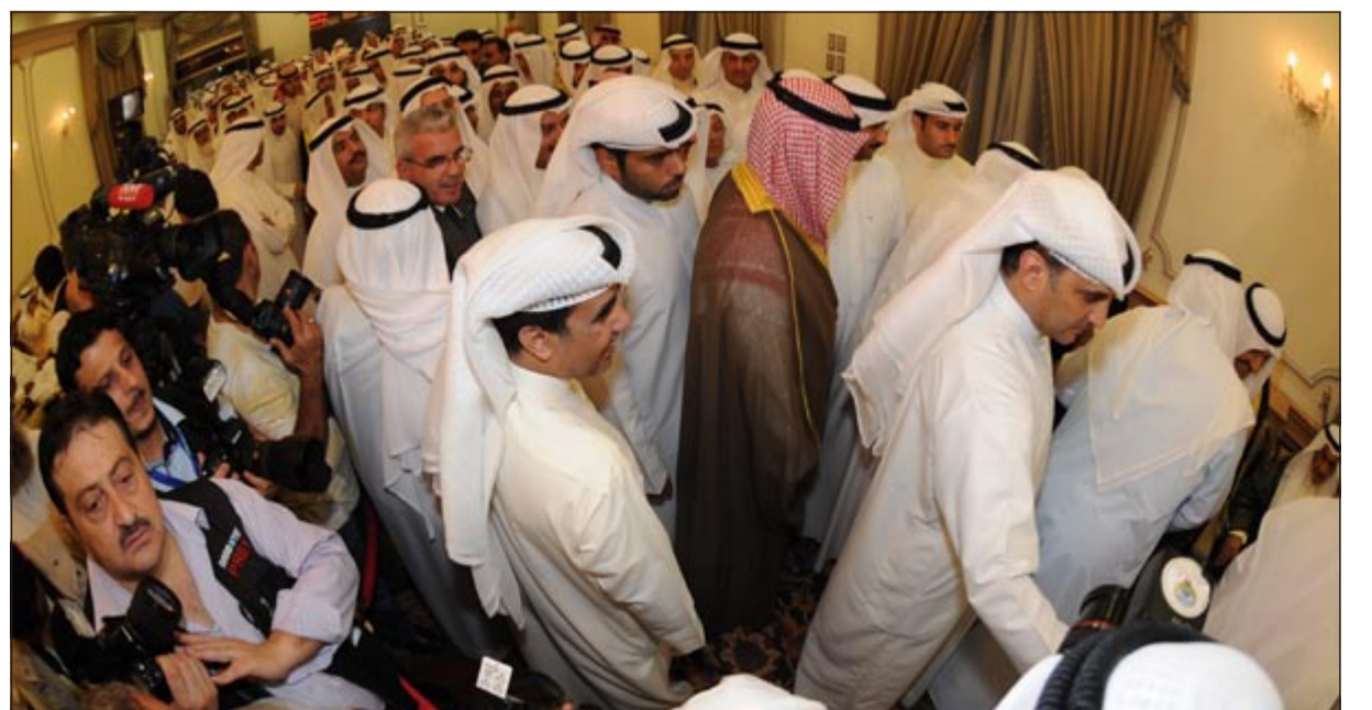
جموع من المهنيين في قصر الشويخ العامر