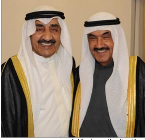
سمو الشيخ ناصر المحمد وجاسم الخرافي