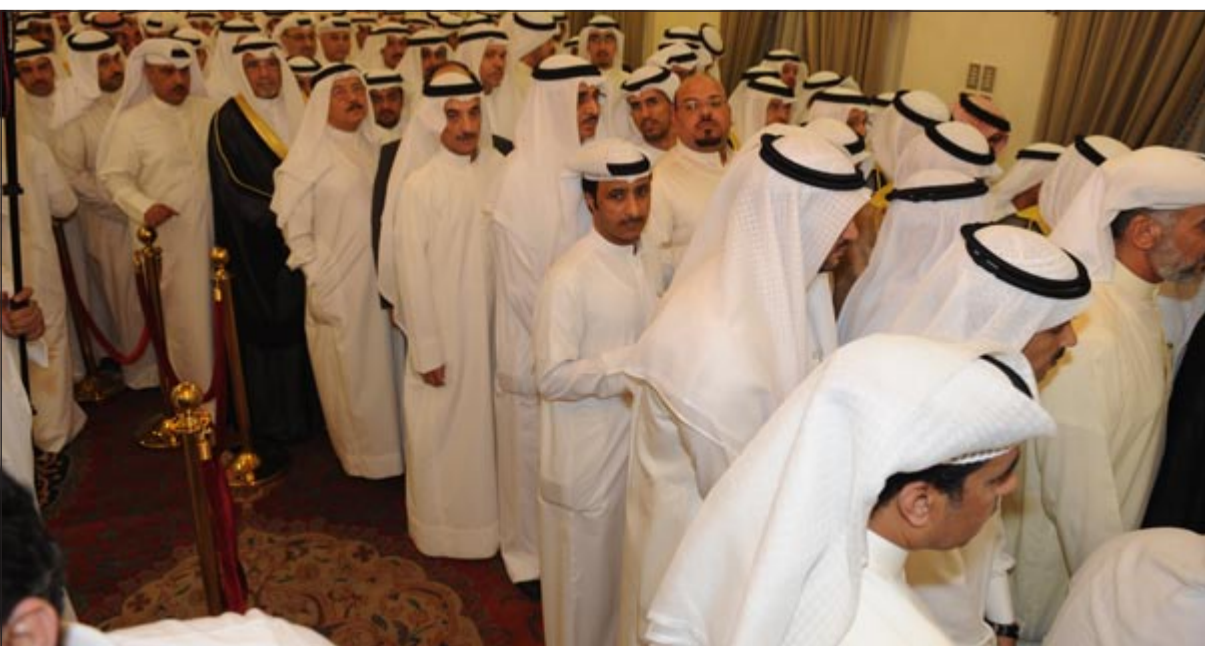
مهنتون لسمو الشيخ ناصر المحمد في الشهر الفضيل