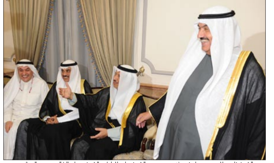
سمو الشيخ ناصر المحمد مرحبا بضيوفه ويبدو سمو الشيخ جابر المبارك والشيخ صباح الخالد ومحمد الصقر