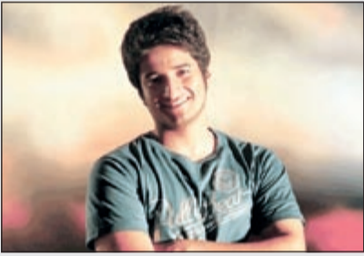
المخرج خالد الرفاعي