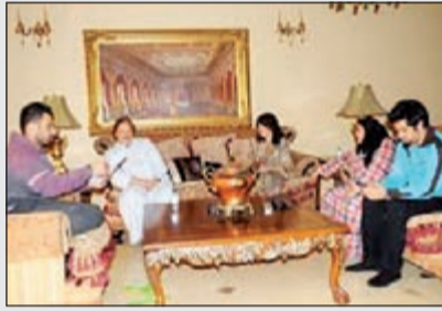
مشهد من مسلسل «بركان ناعم»

بعد مرور سبع حلقات من المسلسل المحلي «بركان ناعم» في جزئه الأول ورغم ما يطرحه من قضايا اجتماعية معروفة للمجتمع، إلا أن ما يميز هذا المسلسل هو إخراجة التي كان بطريقة سينمائية تصدى له خالد الرفاعي وكان عامل جذب للمشاهدين المتابعة أحداث المسلسل السريعة.. إبداع يالرفاعي.